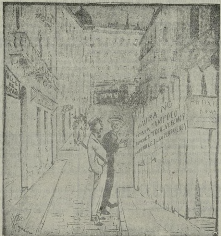
—Y esta valla, para que quede la calle limpia, ¿cuándo la quitaremos?