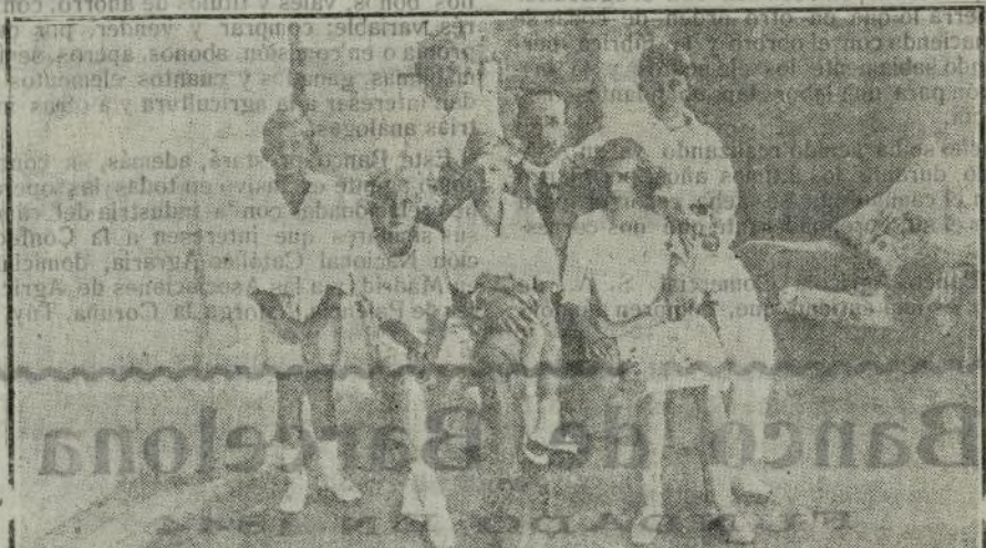
El Soberano y sus augustos hijos.

Ya te habrás enterado por los periódicos de la conversación que hace pocos días tuvo nuestro alcalde con el Rey. Hablaron lar-