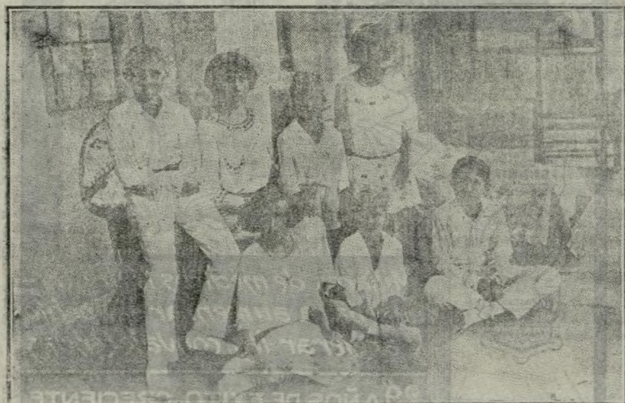
Fotografía obtenida en el Palacio de la Magdalena, en Santander.

Nosotros, que amamos como el qu más la libertad de la tribuna parlamentaria y las prerrogativas inherentes a cargo de representante del país—sean las que fueren sus ideas políticas—, en contraríamos entonces justificada y hasta plausible esa conducta; pero, procediendo fuera de toda lógica, arbitrariamente, por capricho o inspirándose en una voluntariedad hija de la vanidad, o acaso obedeciendo a combinaciones de un maquiavelismo trasnochado, por despecho incluso de otros elementos