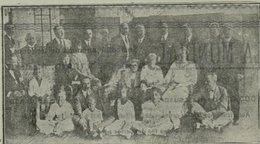
S. S. M. M. los Reyes Don Alfonso y doña Victoria con sus augustos hijos, el Infante D. Fernando y el alto personal palatino.

Opina que es de urgencia proceder a la construcción de villas, que aumentando la población, contribuyan al abaratamiento de los alquileres, y cree que, merced a sus gestiones de hace tiempo, comience muy pronto el servicio de vapores entre Ostende, Trouville y Santander.