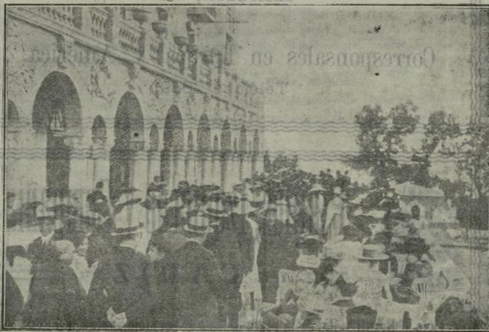
La terraza del Gran Hotel Real, a la hora del té.

nombre de Su Majestad, y a continuación recorrieron los Reyes todas las salas, deteniéndose a examinar las obras.