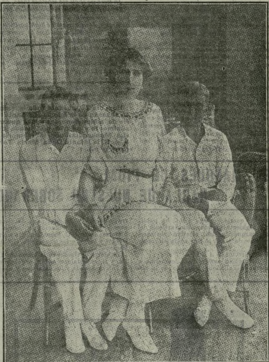
S. M. la Reina Victoria con sus augustos hijos el Príncipe de Asturias y el Infante don Jaime.