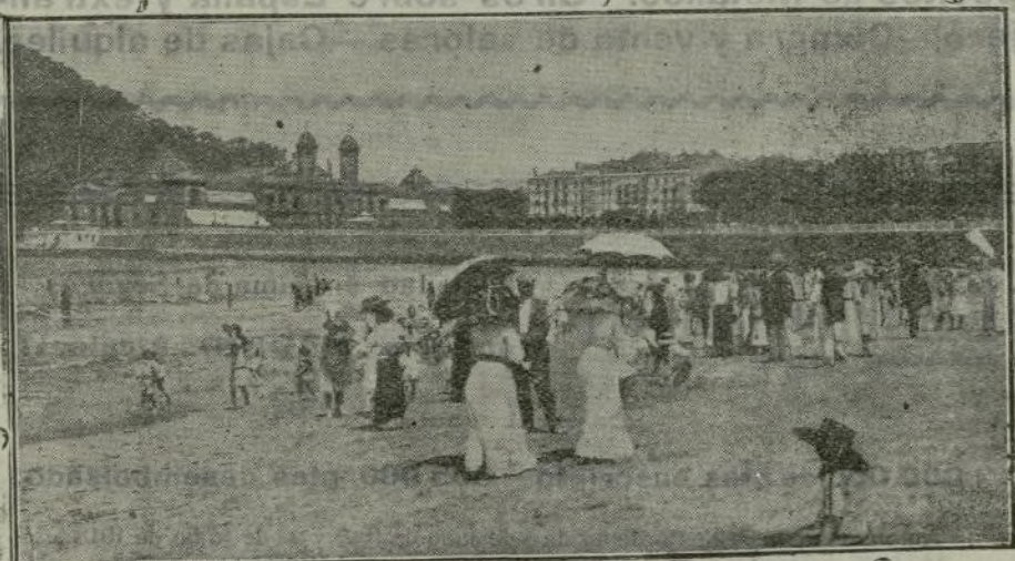
Un aspecto de la playa a la hora del baño.

San Sebastián ofreció a los ojos que por primera vez se recreaban en su contemplación, el espectáculo único del paseo del Castillo, hoy del Príncipe de Asturias, con el inmenso espejo azul del Cantábrico confundiendo con el cielo; fusión de dos azules divinos: mar y éter... Cafa la tarde, el paseo desbordaba de una multitud selecta, y en la tristeza grave del crepúsculo, parpadeaban las lucecitas de Monte Igueldo.