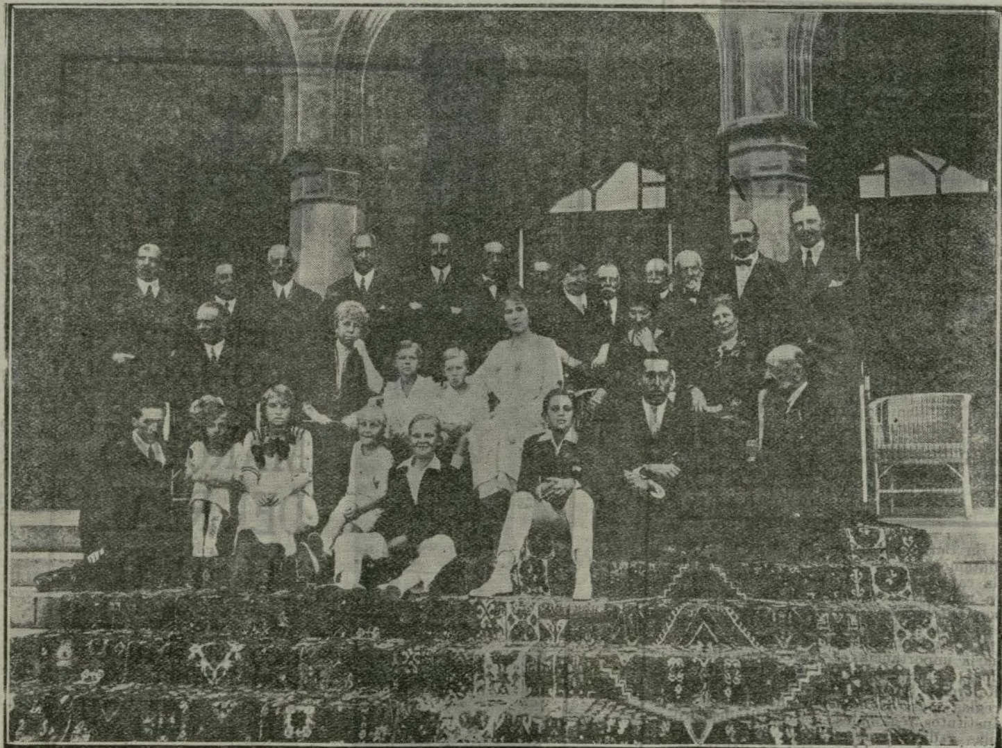
La familia Real y personal palatino, en el Palacio de Miramar, de San Sebastián.

L'armée espagnole depuis quelques années réalise un très avantageux extension de nos dominions en terres marroccaines. Et à présent on vient d'en donner une très touchante preuve avec l'occupation du Fondak. L'opération militaire réalisée, a eu un très brillant succès, et elle constitue un grand triomphe pour nos soldats qui ont dominé la communication de Ain Yedida. Il ne s'agit pas d'une opération définitive, loin de cela; mais ce qu'on vient de faire ce jour-ci renferme une vraie importance comme une tâche de pacification dans notre zone d'influence. L'occupation du Fondak est le premier important pas dans l'avance nécessaire vers l'objectif qui constitue le final décisif, lequel n'est pas autre que la possession de Tanger. Tanger signifie la sûreté de notre influence et si nous réussions à dominer cette ville, toute rébellion de la région yebli serait immédiatement dominée. Nos droits et nos intérêts dans le Maroc s'adressent à un même but. C'est l'idéal de l'Espagne, et pour le voir réalisée, notre armée combat sous l'intelli-