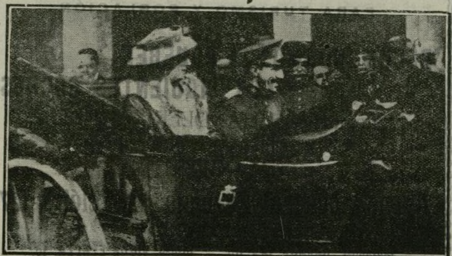
Los Soberanos al llegar a Madrid, de regreso de San Sebastián.