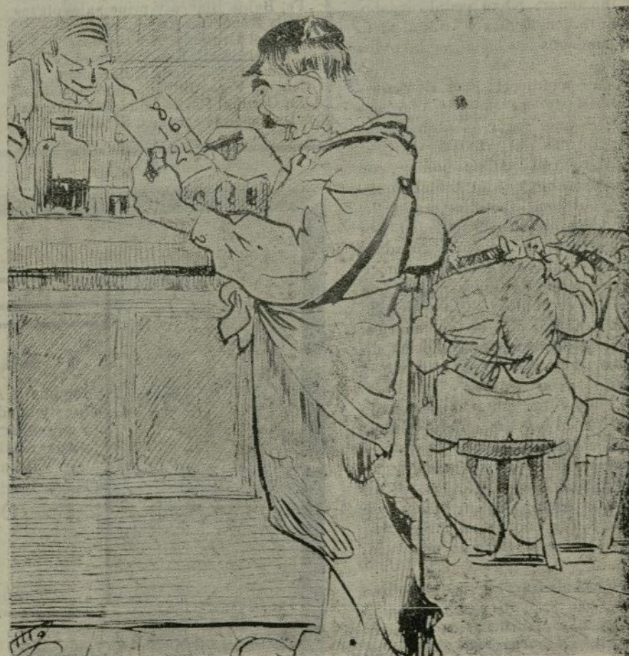
Ocho horas en el andamio y dieciséis en la tasca; total, veinticuatro horas de felicidad sindicada.