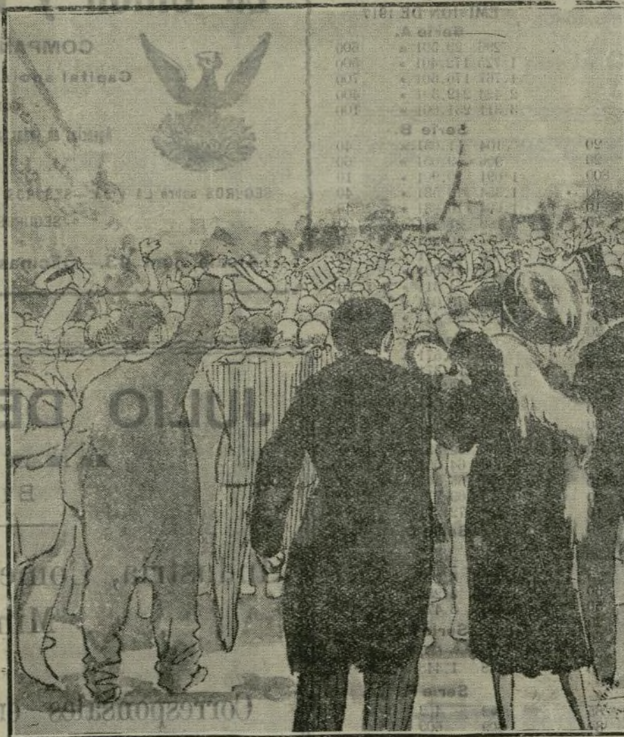
El pueblo de París, como un solo hombre: ¡Viva el Rey!!!