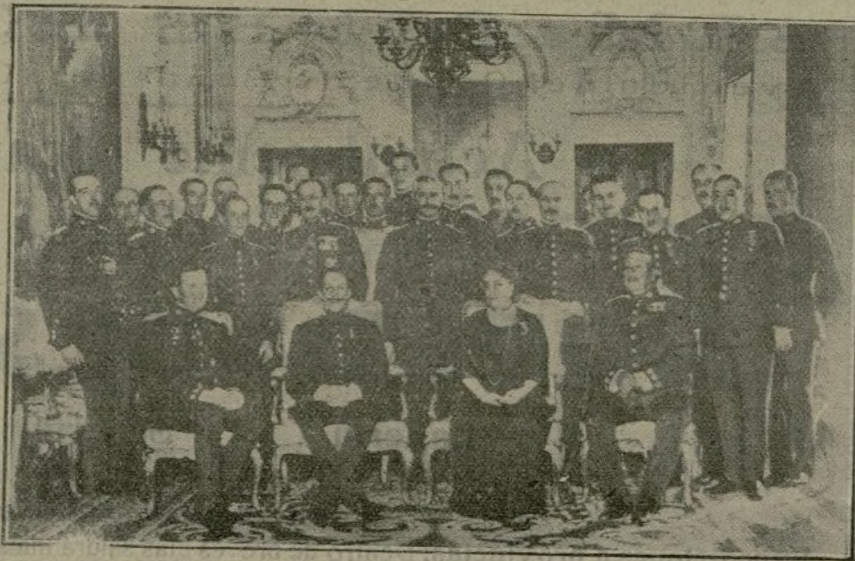
Su Majestad el Rey (1), con el Infante (2), la Duquesa de Talavera (3) y los jefes y oficiales de la Escolta Real que asistieron al almuerzo celebrado en su honor.