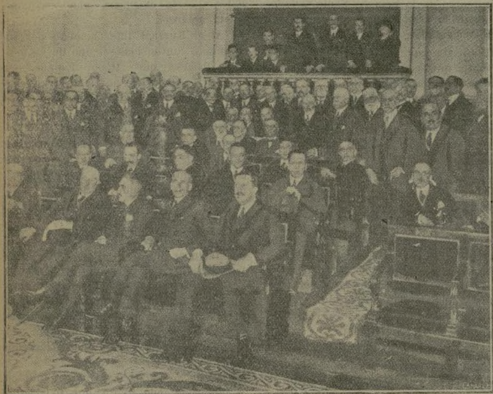
El Marqués de Athucemas pronunciando su discurso en el Senado, ante los ciento setenta y dos parlamentarios que forman parte de la concentración liberal, formada bajo su presidencia, en la mañana del día 8 del corriente.

sino el contraste obligado a que se le somete antes de pasar por el Poder. Es en ese instante cuando surgen de nuevo los partidos políticos, abriéndose sus peculiaridades, vigorizados, plásticos y con ansias de instaurar sus normas y de traducir sus ideales a la realidad. Lo primero es afirmar la independencia, que es la vida y a todos interesa. Luego ya se verá cómo debe vivirse.