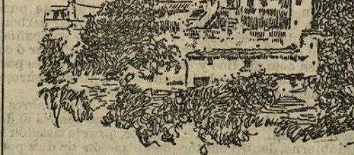
La Cartuja, de Valldemosa

Rayó la recia veterana en los cien años y se conserva ágil y con un genio... endiablado. Resulta un tipo digno de estudio.