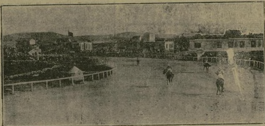
Un aspecto del Hipódromo.

Recomendamos a nuestras lectoras y lectores que visiten la Joyería de