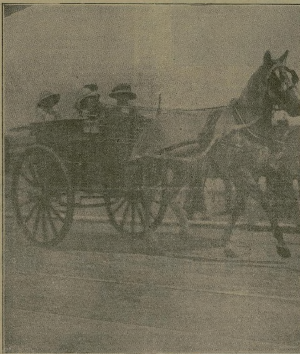
Es esta una simpática nota del veraneo de las Infantitas en la capital santomerina. Sus Altezas Reales Doña Beatriz y Doña Cristina bajan a la playa en el cochecillo que reproduce el grabado, y en ella pasan casi toda la mañana, en unión de sus augustos hermanos