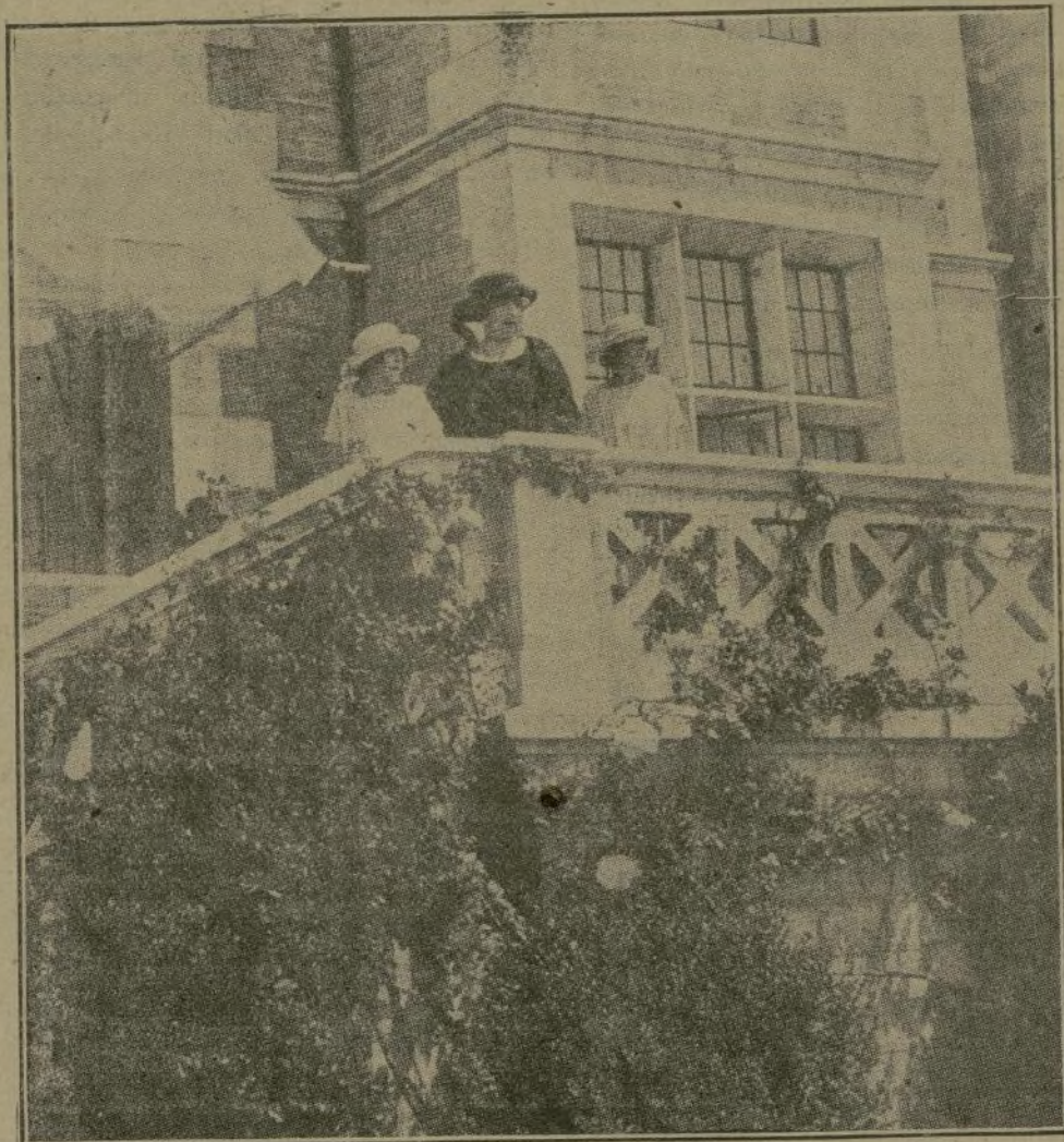
La Soberana con sus Altezas las Infantitas Doña Beatriz y Doña Cristina momentos después de su llegada al Real Palacio de la Magdalena.