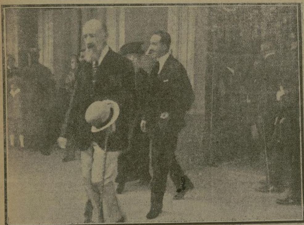
El Monarca a su llegada para inaugurar la temporada de carreras de caballos.

En el palco regio estaban las augustas personas mencionadas, y en la entrada general agolpábase la multitud con enorme ansiedad por presenciar el interés de