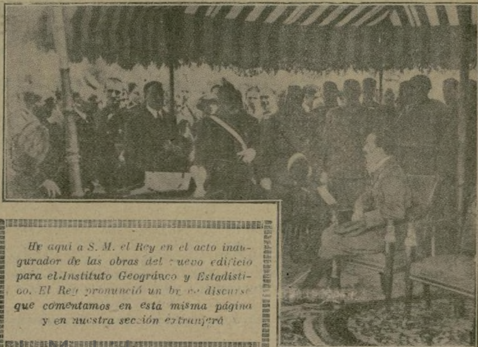
He aquí a S. M. el Rey en el acto inaugurador de las obras del nuevo edificio para el Instituto Geográfico y Estadístico. El Rey pronunció un breve discurso que comentamos en esta misma página y en nuestra sección extranjera.

But when such truths are uttered by the lips of a King, they have such force that one should not be over much surprised to see them give rise to an antimonarchic hatred when it may chance to hurt even monarchic followers, who are sensitive on points of their own responsibilities to the extent of getting a dislike to hear the truth. But nowadays, the modern Kings who are essentially and who to do things for the best speak in like manner, whether within or without the Constitution. Above the wording of a Constitutional law there is the spirit of the Chief of the Nation who seeks the welfare of his country.