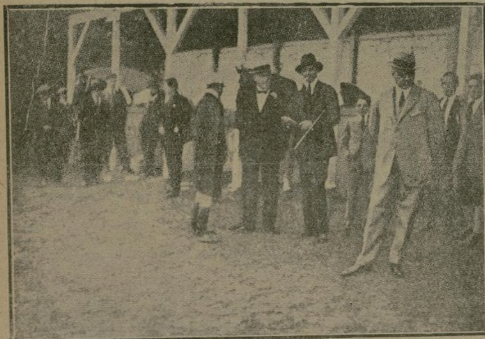
El Soberano en el Hipódromo de La sarte con el entrenador y el jockey.

Agradó mucho la novedad en el sistema de dar la salida a los caballos el