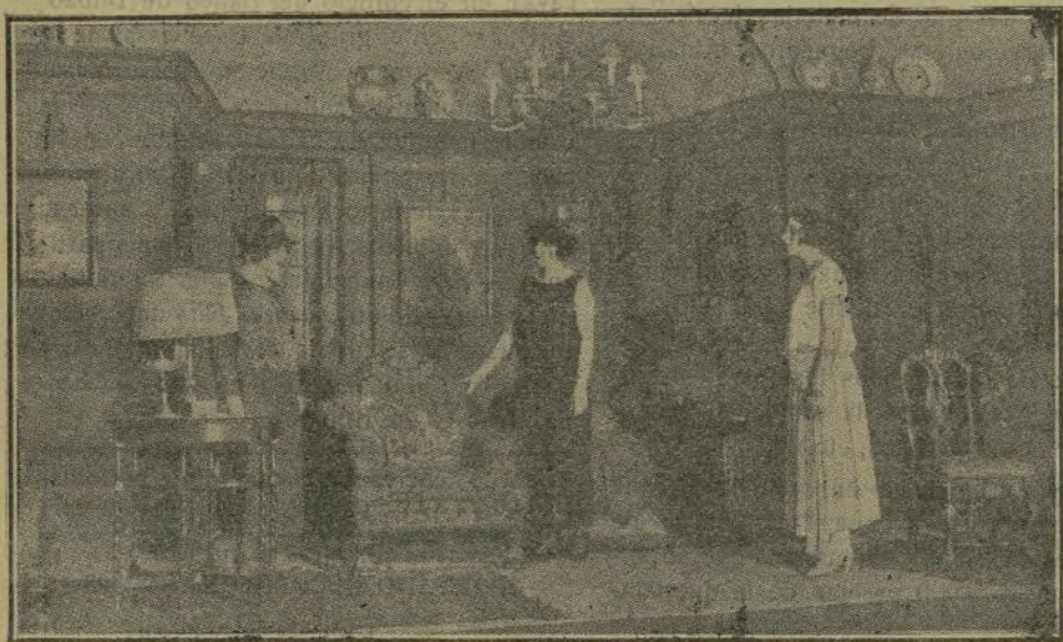
Una escena de la comedia, de D. Honorio Maura, «Corazón de mujer», estrenada anoche en Es-lava.

cibida por el público con indudable agrado.