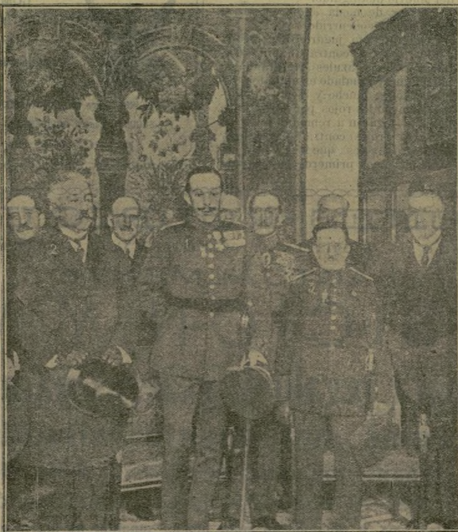
El Soberano en la inauguración del curso de investigación biológica, acompañado del Ministro de la Guerra, Sr. Alcalá Zúñiga, el capitán general Sr. Weyler y otras personalidades.