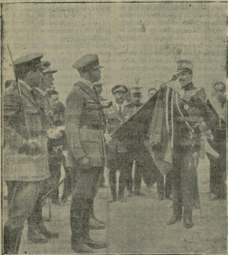
S. M. el Rey imponiendo en Sevilla la corbata de la Medalla Militar a la bandera del Cuerpo de Aviación

Los infortunados aviadores Palanca y Pérez Peñamaría, comandante de Ingenieros y capitán de Estado Mayor, respectivamente, muertos al emprender el viaje de Tetuán a Sevilla en medio del temporal que hizo preciso el aplazamiento de la fiesta; constituye una prueba del desprecio a los riesgos por nuestros valientes aviadores.