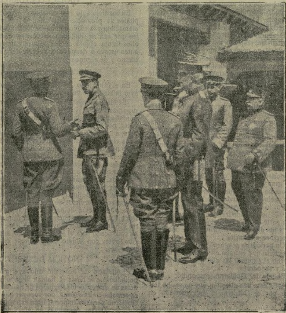
Durante su estancia en Sevilla, tanto la Soberana como el Rey han girado diversas visitas interesantes. Una de ellas fué la del Monarca al cuartel de Artillería acompañado de S. A. el Infante Don Carlos, Capitán General de Andalucía. Su Majestad salió muy satisfecho del cuartel por haberlo encontrado en perfecto estado de organización y disciplina.