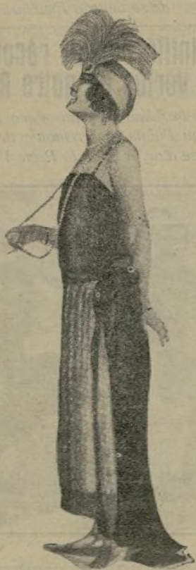
Una dama elegante luciendo pendientes y collar de PERLAS JAPÓN