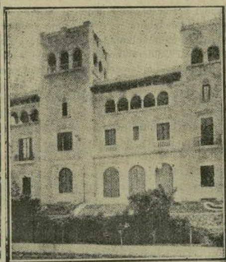
Palacio del Marqués de Alella, en Barcelona, en el que se ha celebrado un baile oficial en celebración del cumpleaños de S. M. el Rey, el día 17 del corriente.

Por su suntuosidad y riqueza resulta poco menos que imposible transcribir en estas líneas la reseña del baile de gala celebrado el día 17 en la señorial morada del Alcalde de Barcelona, señor Marqués de Alella, con motivo de celebrarse el cumpleaños de Su Majestad el Rey Don Alfonso XIII.