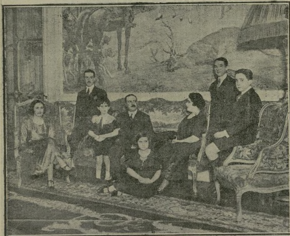
Los Marqueses de Amboage con sus cinco hijos y su hijo político el Marqués de Valdeosera.

El reembolso de los títulos amortizados se efectuará, contra entrega de los mismos y con deducción de impuestos, a partir del 1