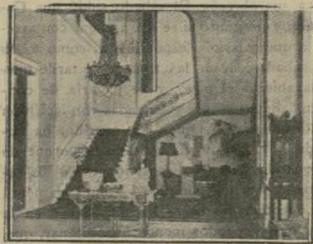
Escalera. Al pié de ella la escultura de Benlliure, «La bailarina»