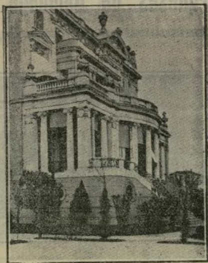
Fachada posterior del Palacio.

Ante el altar mayor recibieron los novios