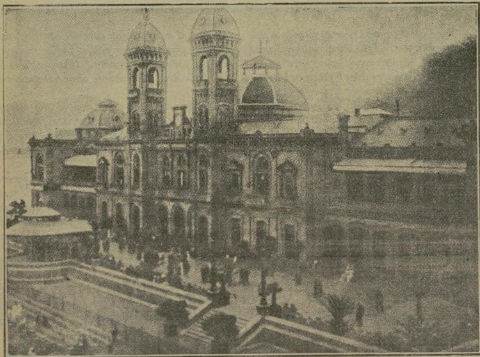
La terraza del Gran Casino de San Sebastián durante el paseo en ella por las tardes