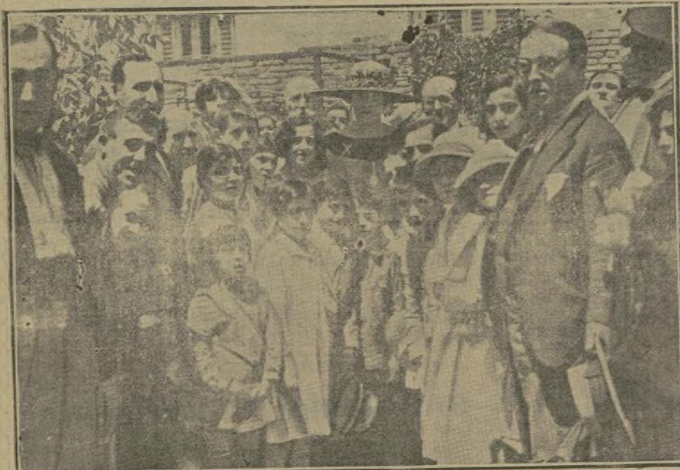
S. M. la Reina Doña Victoria Eugenia que, tan especial satisfacción encuentra ocupándose en menesteres piadosos, aparece en el presente grabado durante el reparto de prendas llevado a cabo entre los niños y niñas de los tres dispensarios antituberculosos de Madrid que han de constituir las colonias escolares de Oza y Pedrosa este verano.