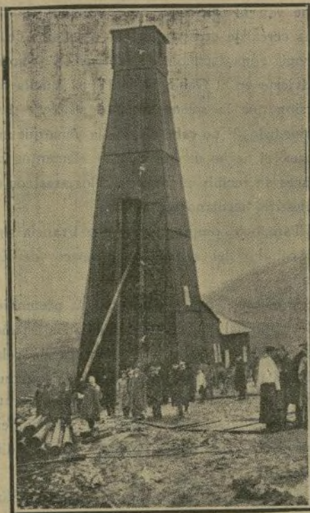
Inauguración del pozo «Pechelbrom» de la Compañía Franco-Española de Petróleo en Elorrio (Vizcaya).

No es nuestro objeto sacar del cartel anónimo a entidad tan arraigada y valiosa como la