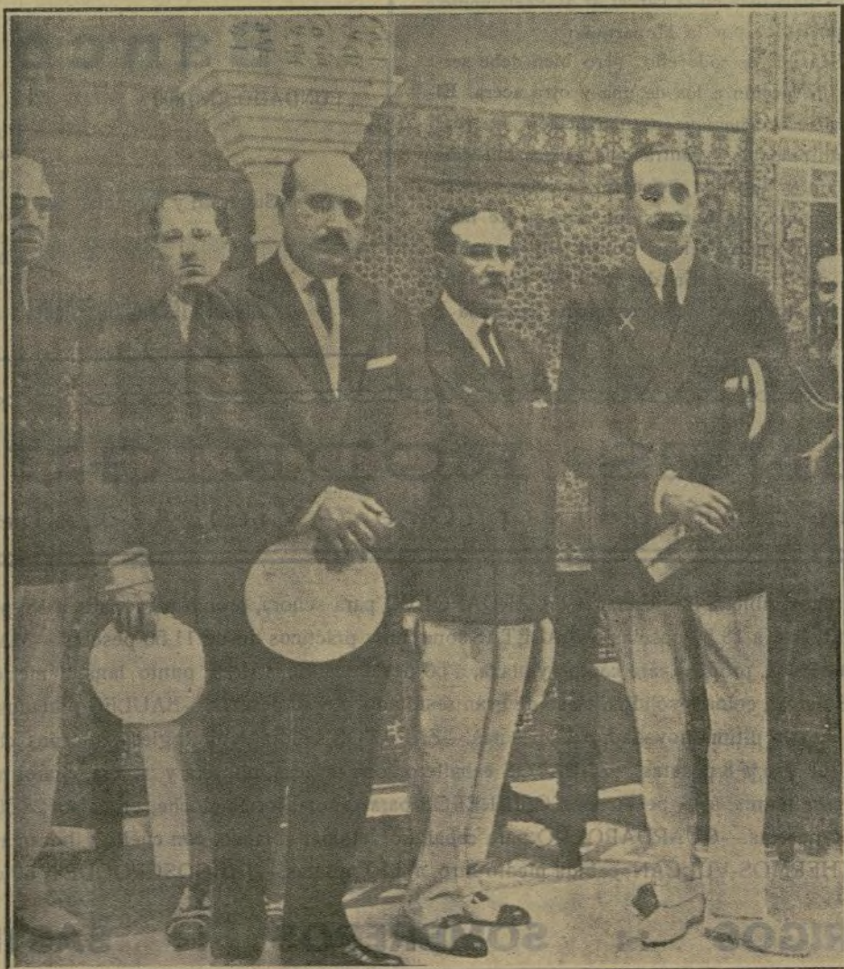
Durante la reciente estancia en Bilbao de nuestro Soberano, S. M. hubo de visitar el buque que lleva su augusto nombre. El grabado ofrece un instante de la visita que el Monarca hizo con especial complacencia, quedando de ella muy satisfecho, según manifestó al abandonar el trasatlántico «Alfonso XIII», donde fué aclamado con el mayor entusiasmo.