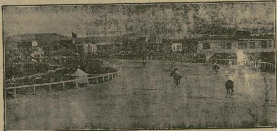
Un aspecto del Hipódromo