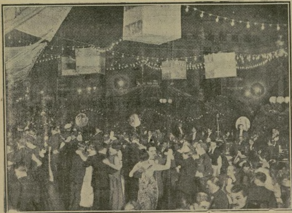
Aspecto de la terraza del Gran Casino durante la primera fiesta del Arte y de la Danza, que tan gran éxito ha obtenido entre la aristocrática concurrencia asidua al primer establecimiento de recreo donostiarra.