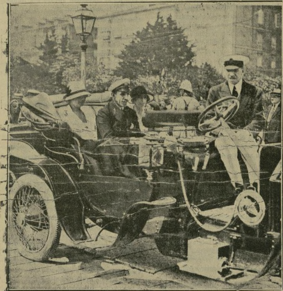
Su Majestad el Rey, con las Duquesas de Santaña (2) y de la Victoria (3) de regreso de una excursión marítima.

Querida Celia; Mi veraneo transcurre aquí en medio de las más agradables distracciones. No creo que en el extranjero, tan decantado en todo por venir de fuera, según inveterada costumbre española, haya playas que superen a la mía en animación mundana, bondad de clima y belleza de lugares. El Sardinero no trata de aventajar a ninguna, más