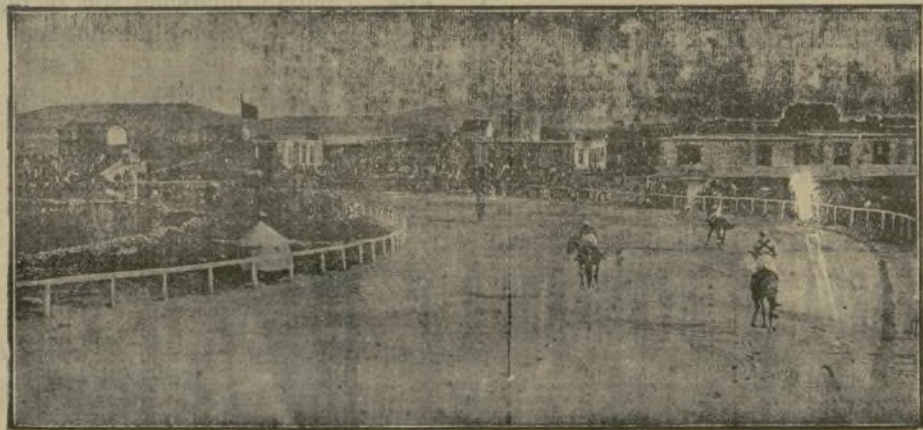
Un aspecto del Hipódromo