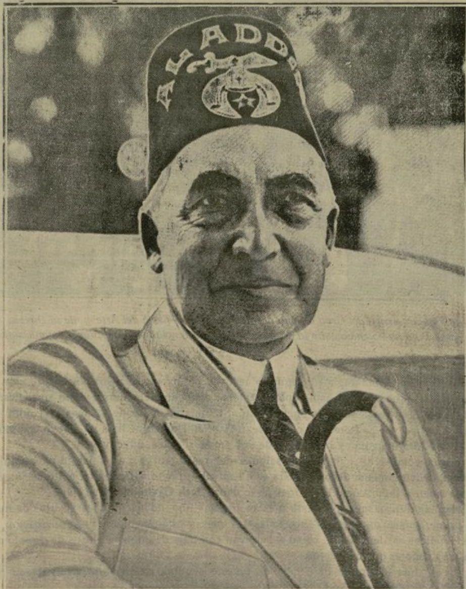
El Presidente de los Estados Unidos, Mr. Harding, fallecido en San Francisco de California, ciñendo el típico gorro, durante la parada de la Convención Nacional que tuvo lugar el día 6 de junio último

In the speech that Mr. Harding was going to pronounce in San Francisco de California—and which his Secretary has just published—he expressed his conviction that America ought to take part in the projected international Court of Justice, because it would be a good measure to obtain a universal peace.