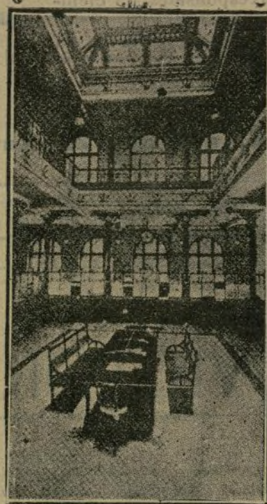
«Hall» del Banco Guipuzcoano