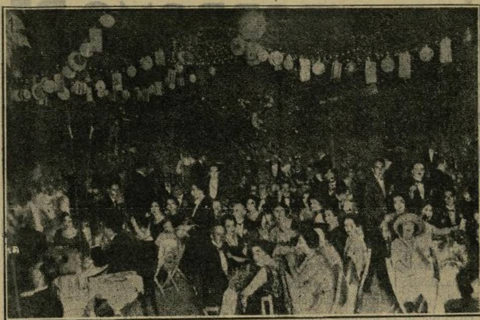
Aspecto en la terraza del Gran Casino de San Sebastián durante el hermoso festival titulado: «A la luz de la luna».

Arrojar acusaciones y adjetivos de menoscabo sobre los fabricantes es más cómodo que reflexionar y destruir esas razones que los fabricantes han expuesto; pero no es justo.