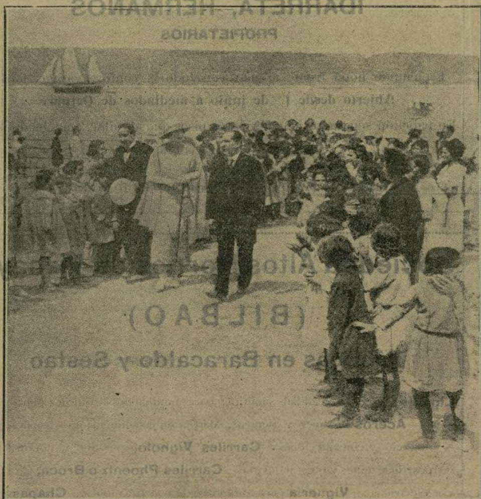
Nuestra Soberana al llegar al Sanatorio de la Pedrosa para visitar las colonias escolares

Luces deslumbrantes, mujeres hermeas, «toilettes» estupendas, distinción, animación... y «el Hada Armonía rimando sus vuelos» que dijo el exquisito Rubén al