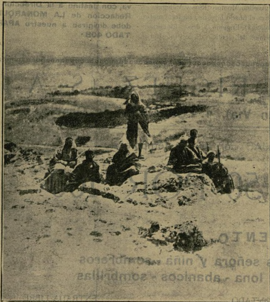
El grupo de moros adictos observando las maniobras de las tropas.