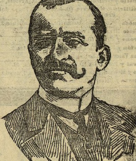
Conde de Romanones ministro de Gracia y Justicia

A cumplimentar al Sr. Dávila acudieron también los tenientes de alcalde y concejales del Ayuntamiento de Madrid, que le dieron