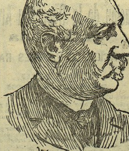
D. Pio Gullón ministro de Estado

El delegado regio de Pósitos Sr. Zorita ha presentado la dimisión de su cargo; pero el