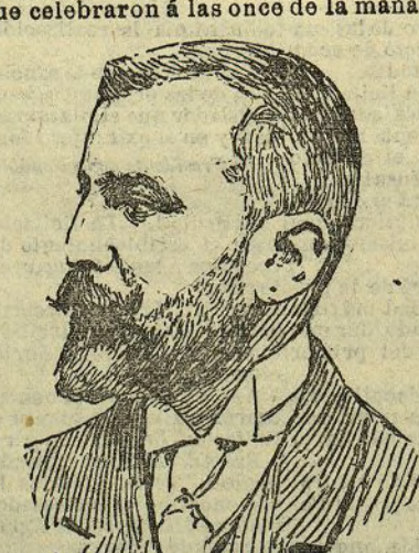
D. Amalio Jimeno ministro de Instrucción pública

Después de esta negativa, y en la entrevista que celebraron a las once de la mañana los