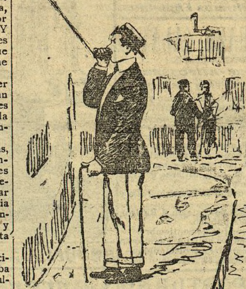
Pelando la "pava" por teléfono

Dirijo mis pasos primero hacia el moderno Parque del Oeste. Dado este sol africano y derribante que en este Junio al templo disfrutamos, deduzco que estas horas primeras del día son las más á propósito para ir á tal lugar.