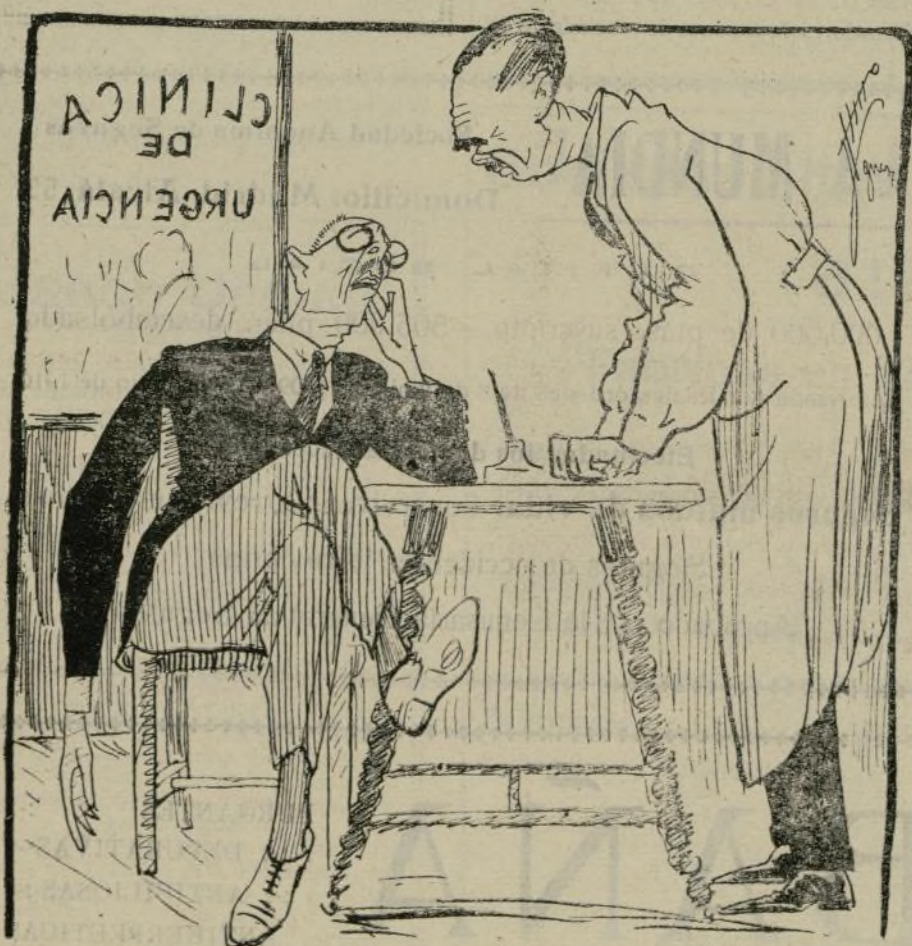
Entre médicos.—La verdad es que si todos los gobernadores procedieran como el duque de Tetuán, se cerrarían las clínicas de urgencia por falta de clientes envenenados.