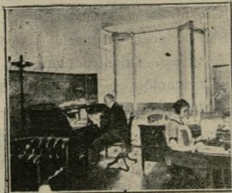
Dirección de «Publicitas»

Deseábamos ver la instalación y el funcionamiento de esta importante Agencia de Publicidad, a cuya apertura en Madrid, Gran Vía, 13, precedió la fama adquirida por una actuación de veintidós años en Barcelona.