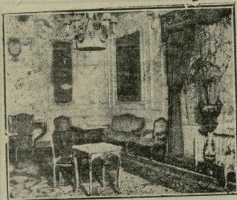
Saloncito del «restaurant» en el Palacio de Hielo.

El sábado último por la tarde, inauguróse la presente temporada de invierno en el Palacio de Hielo, asistiendo una