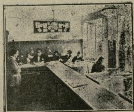
Sección de presupuestos, propagandas y distribución de anuncios