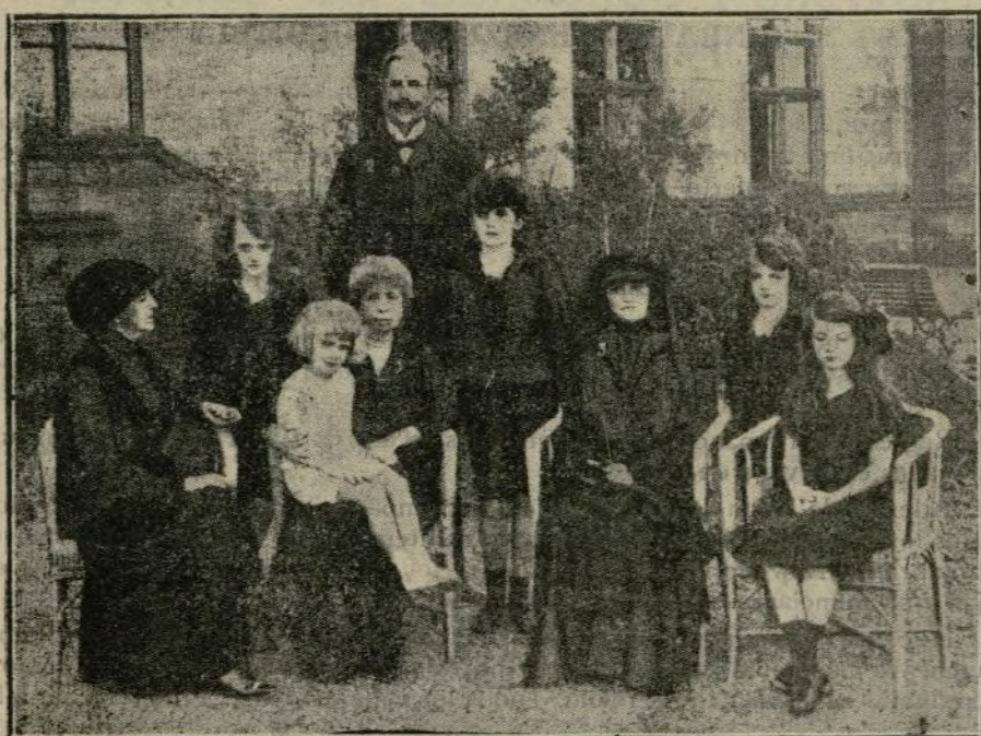
S. M. la Reina Doña María Cristina (1), y su hermano el Archiduque Eugenio (2), visitados por la ex Emperatriz Zita, de Austria-Hungría (3), con sus hijos, en los jardines del Palacio de Miramar en San Sebastián.

La Reina Doña María Cristina y la Ex-emperatriz