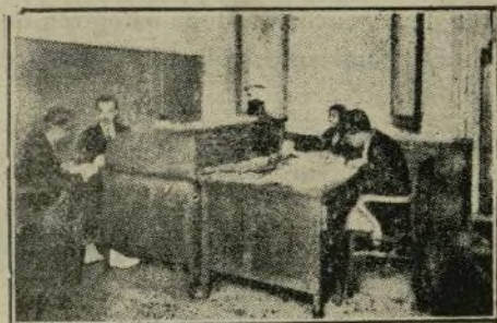
Dirección técnica de «Publicitas» en Madrid

Uno de esos hombres laboriosos e inteligentes que emprendieron la tarea de estudiar y divulgar la ciencia publicitaria—movimiento que tuvo su cuna en los Estados Unidos y se extendió rápidamente por los demás países—dijo en una