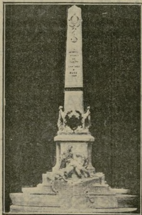
Monumento a los héroes de Santiago de Cuba y de Cavite, inaugurado en Cartagena por S. M. el Rey

El señor presidente de la Comisión del monumento ha dicho elocuentemente que no se trata aquí del homenaje a aquellos que ya dejaron en nosotros y en nuestro corazón consagrado el recuerdo de sus nombres; no. No se trata de rendir homenaje oficial a los marinos nunca olvidados, a aquellos que