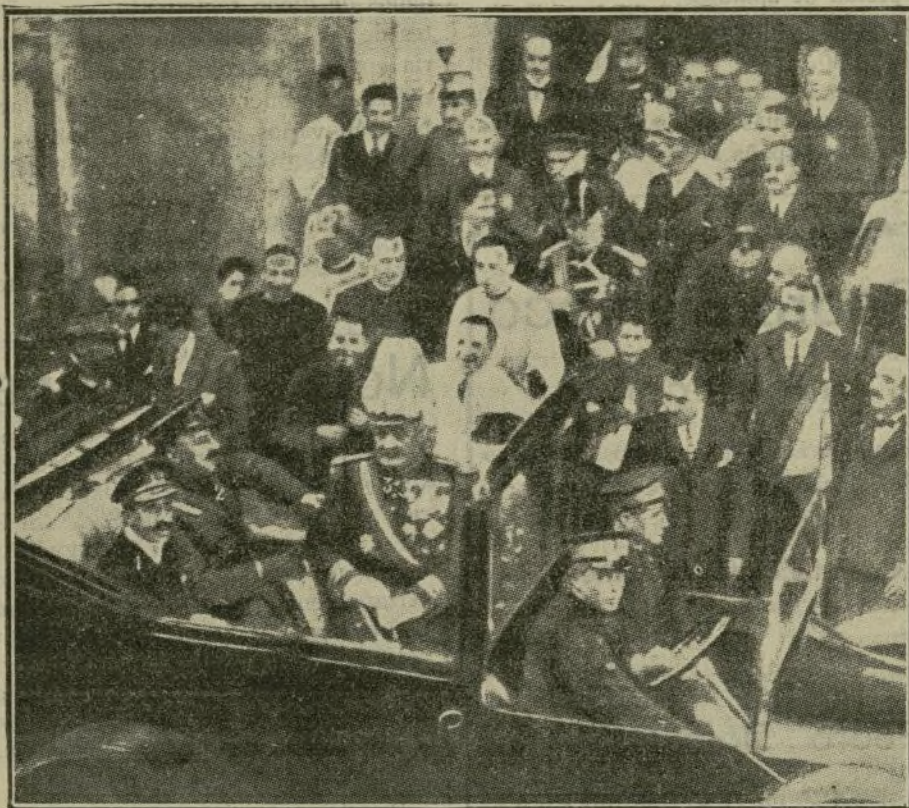
S. M. el Rey D. Alfonso XIII (1), con el General Primo de Rivera (2) y el Capitán General de Valencia (3) al salir del «Tedeun» en la Iglesia de la Caridad en Cartagena.

Quizá la grandeza del acto, acaso la emoción que siento, arranquen de mí