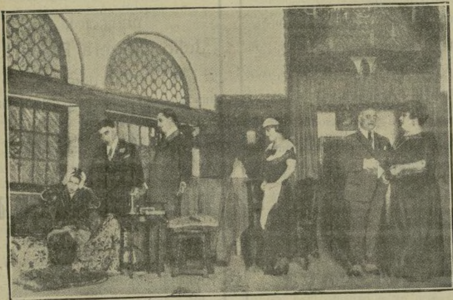
Una escena de la comedia de gran éxito «El amor no se ríe»