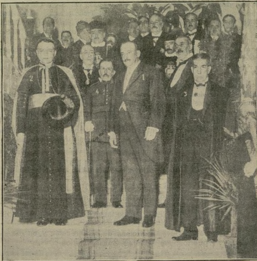
El presidente del Directorio, marqués de Estella (1), con el de la Academia, señor Bergamín (3); el nuncio de Su Santidad, monseñor Tedeschini (2); el general Weyler (4) y otros distinguidos concurrentes a la sesión de apertura de curso.

Su docto discurso versó sobre los Tribunales de comercio y sobre la necesidad de dar cauces jurídicos a las luchas sociales, para terminar con unas invocaciones al Directorio, considerando su misión de restablecer la autoridad, que