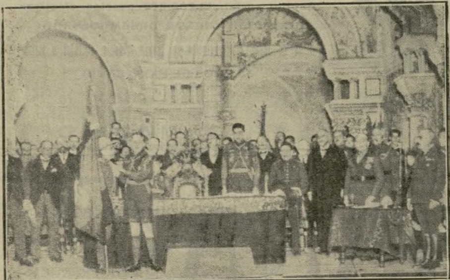
S. A. R. el Príncipe de Asturias (1) imponiendo la medalla de constancia al abanderado de los exploradores en la fiesta de la Promesa de la bandera, a la cual concurrió con sus augustos hermanos los infantes D. Jaime (2) y D. Gonzalo (3)