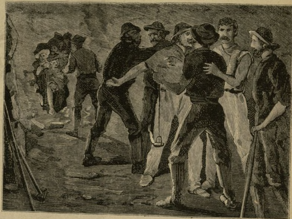
SAN GOTHARDO.—REUNION DE LOS OBREROS ITALIANOS Y SUIZOS EN EL CENTRO DEL TÚNEL