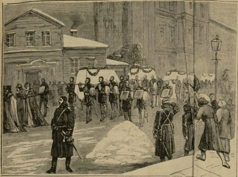
RUSIA.—ENTIERRO DE LOS SOLDADOS QUE PERECIERON EN LA EXPLOSIÓN DEL PALACIO DE INVIERNO