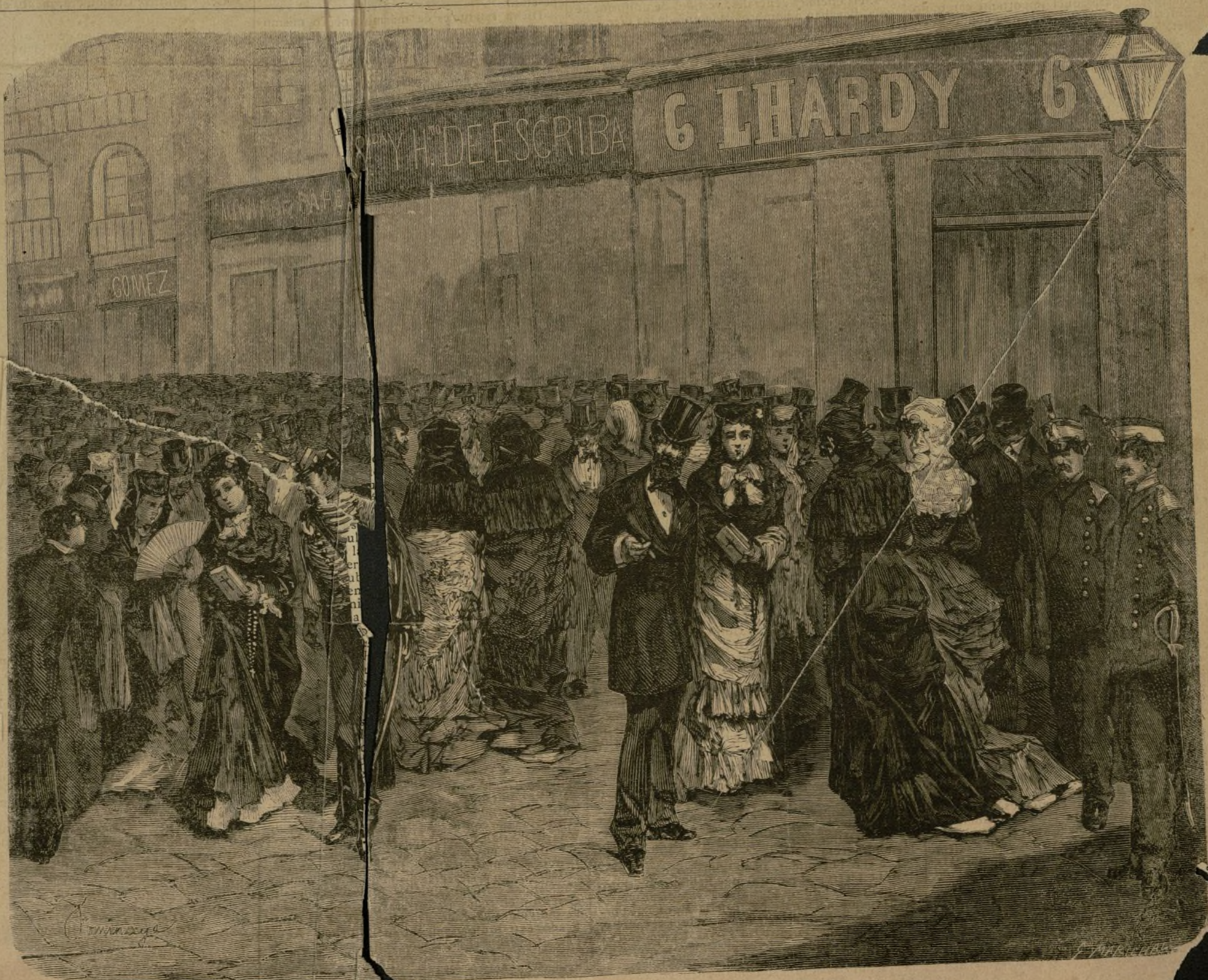
MADRID.—PASEO EN LA CARRER DE SAN CRÓNIMO, EN LA TARDE DEL VIERNES SANTO (Composicion y dibujo de D. Domingo Muñoz.)

Tú, público ilustrado, que eres juez inapelable, examinarás nuestros hechos y pronunciarás el fallo; y ten cuenta que de tí, sólo de tí, esperamos imparcialidad y justicia.