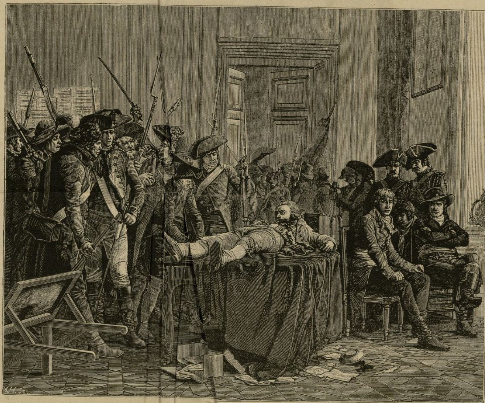
BELLAS ARES. EL 10 DE TH. (Cuadro de M. Lucien Melingue, premiado.)