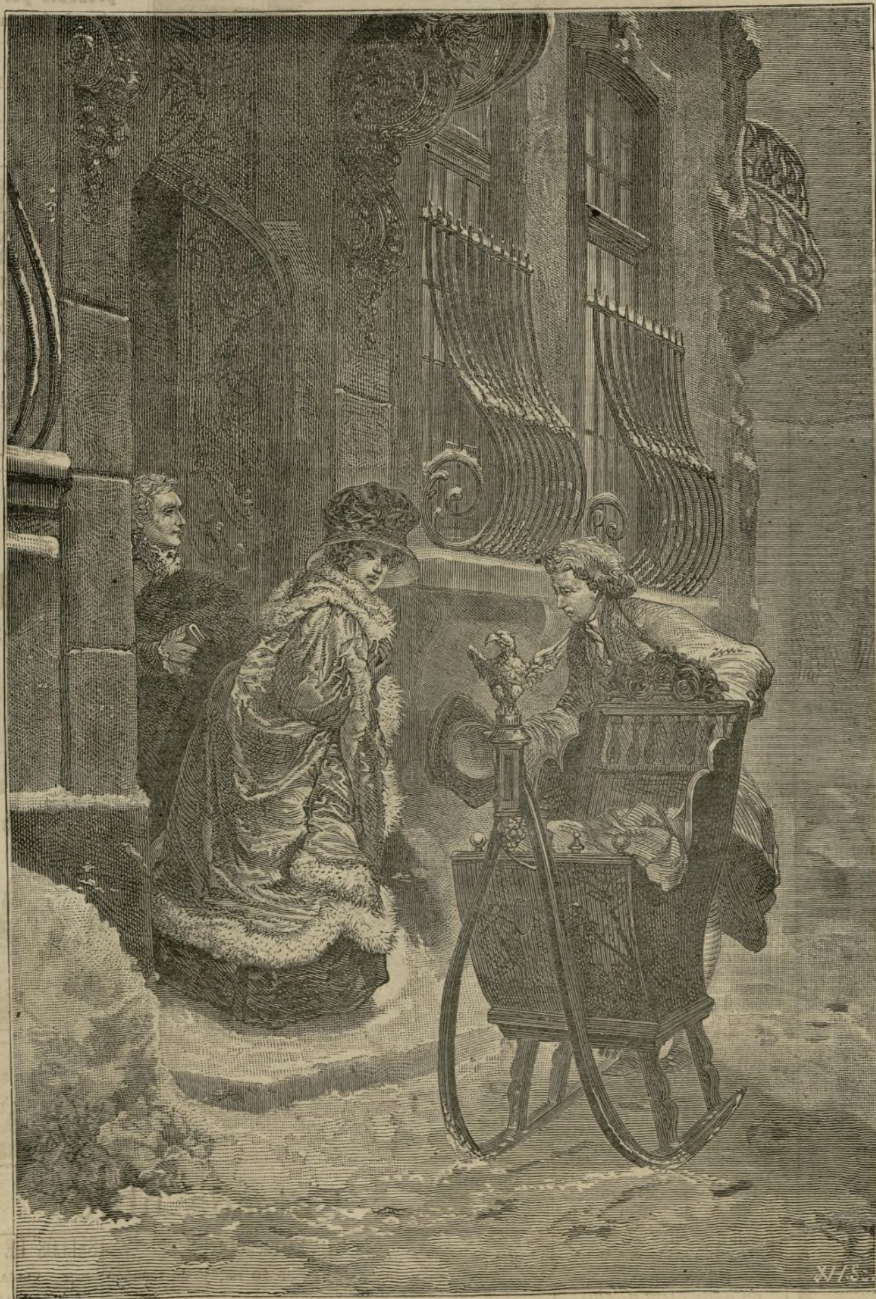
UNA EXCURSION EN TRINEO. -- CUADRO DE M. KAMMERER.