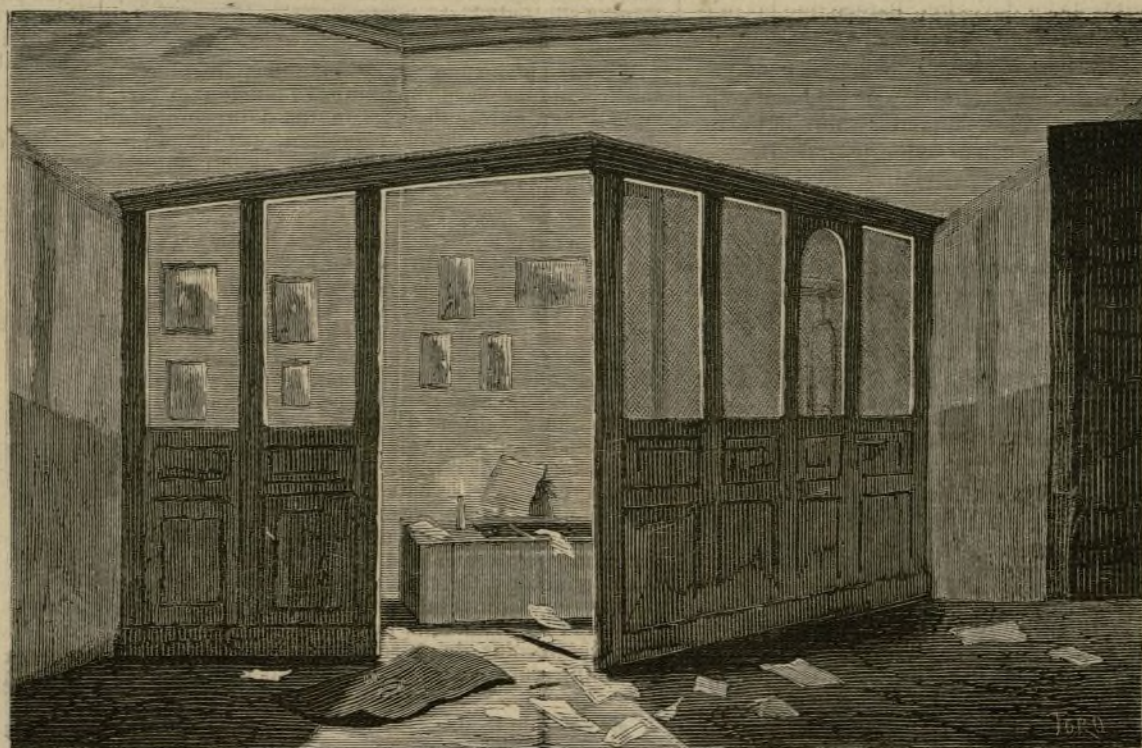
Aspecto de la habitacion donde se hallaba la caja, despues del robo