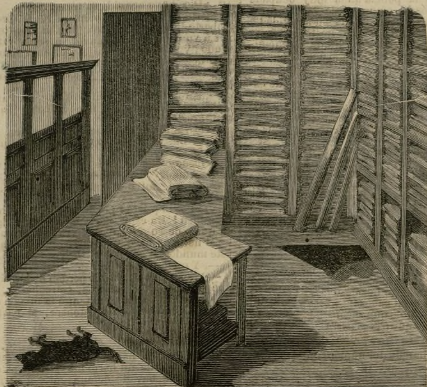
Vista de la boca del escaló por donde penetraron á los almacenes.