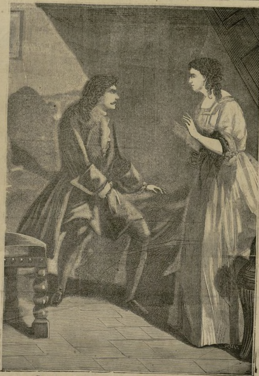
Pues bien, Hilda, yo haré de Vd. la reina del mundo.

En tanto que esto pasaba en la calle de Bons-Enfants, la viuda que vivía en la calle de San Honorato entró en su habitación, y se extrañó ver á su hija absorta en la contemplación estática de la moneda de oro dada por Gerardo.