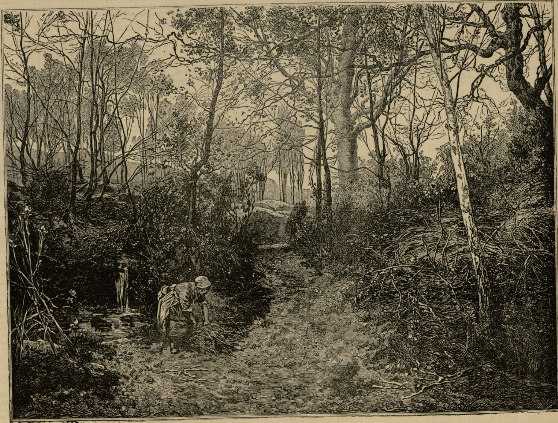
BELLAS ARTES. — UNA TARDE DE OTOÑO.

El prestatario que al pedir un préstamo envíe una relación clara, aunque sea breve, de sus títulos de propiedad, obtendrá una contestación inmediata sobre si es posible el préstamo, y tendrá mucho adelantado para que el préstamo se conceda con la mayor celeridad, si hay términos hábiles. En la contestación se le prevendrá lo que ha de hacer para completar su titulación en caso de que fuere necesario.