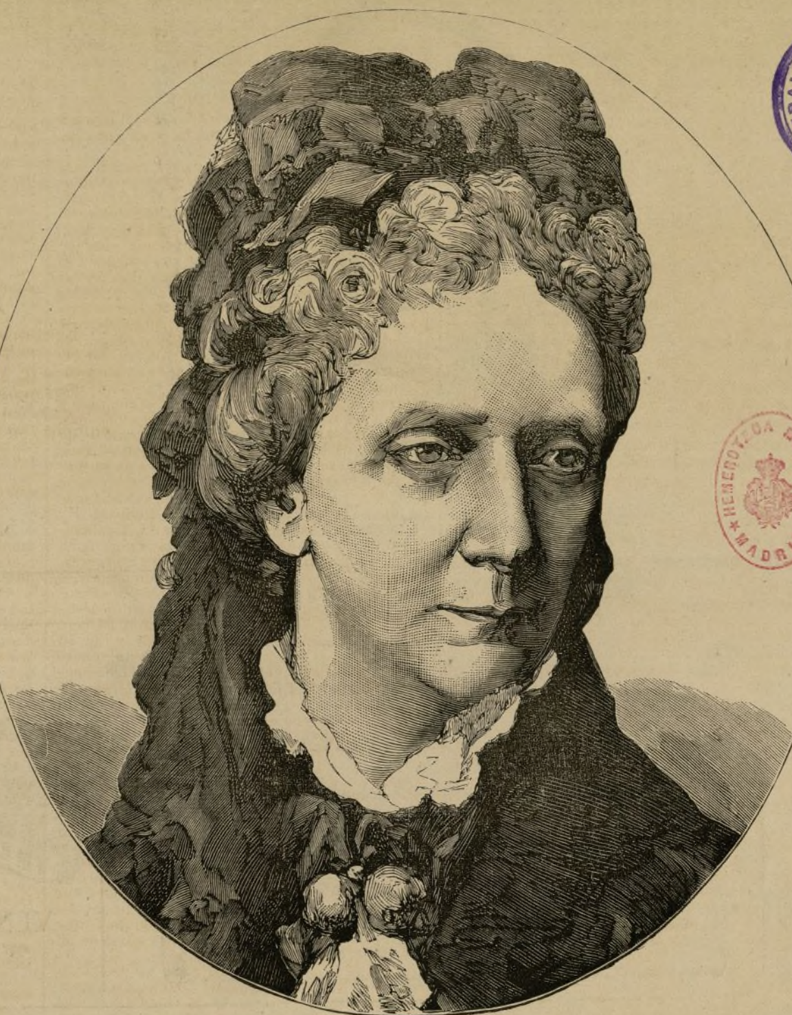
† LA EMPERATRIZ DE RUSIA

Un inglés aficionado á la estadística ha calculado últimamente que en la guerra que la Gran Bretaña sostiene contra los cafres del Afghanistan, cada indigena muerto por los invasores costaba á Inglaterra la suma de 125 libras esterlinas, ó sean unos 12.500 reales.