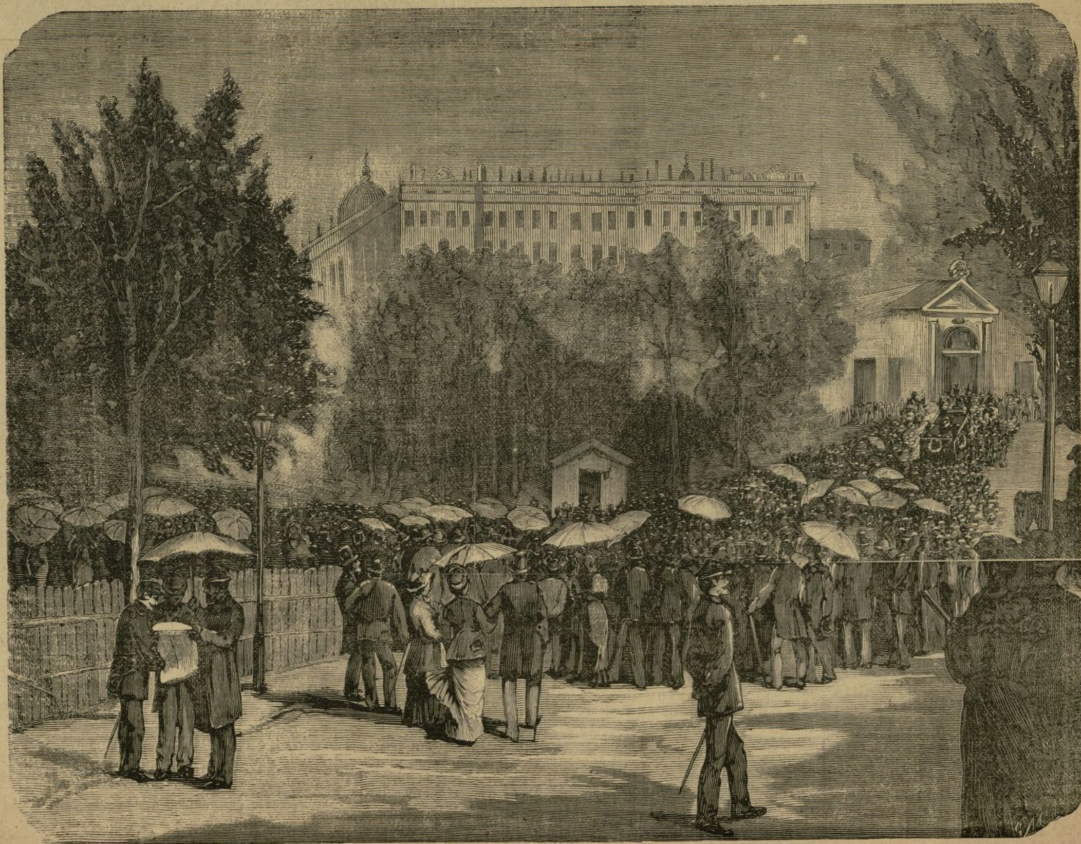
Completos del cap. IV de A. F. de los Rios desde la Estacion del ferro carril del Norte á la Sacramental de San Martin

La máquina enmudece; las cajas se cruzan de telas de araña, donde el monstruo atrapa moscas, como el fiscal periódicos; las mesas de la redaccion se cubren de una capa de polvo; las plumas enmohecen; la tinta, como un río estancado, se