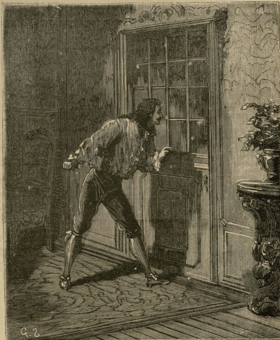
EL BIGAMO.—...Contra cuya débil hoja aplicó el oído.