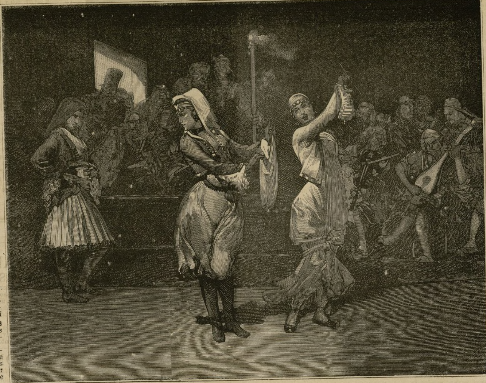
COSTUMBRES DE CHIPRE.—LA DANZA.

El prestatario que al pedir un préstamo envíe una relación clara, aunque sobra ve, de sus títulos de propiedad, obtendrá una contestación inmediata sobre si es posible el préstamo no tendrá mucho adelantado para que el préstamo se proceda con la mayor celebridad, si hay términos hábiles.—En la contestación de le prevendrá lo que ha de hacer para completar su titulación en caso de que fuere necesario.