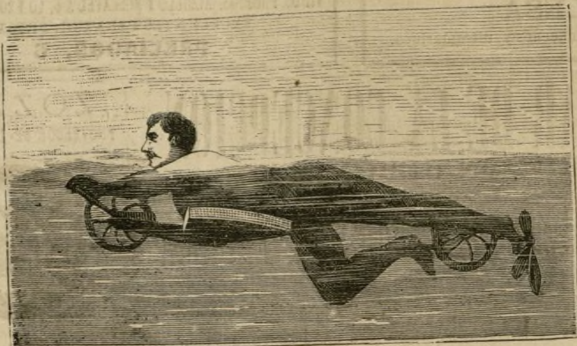
NUEVO APARATO DE NATACION