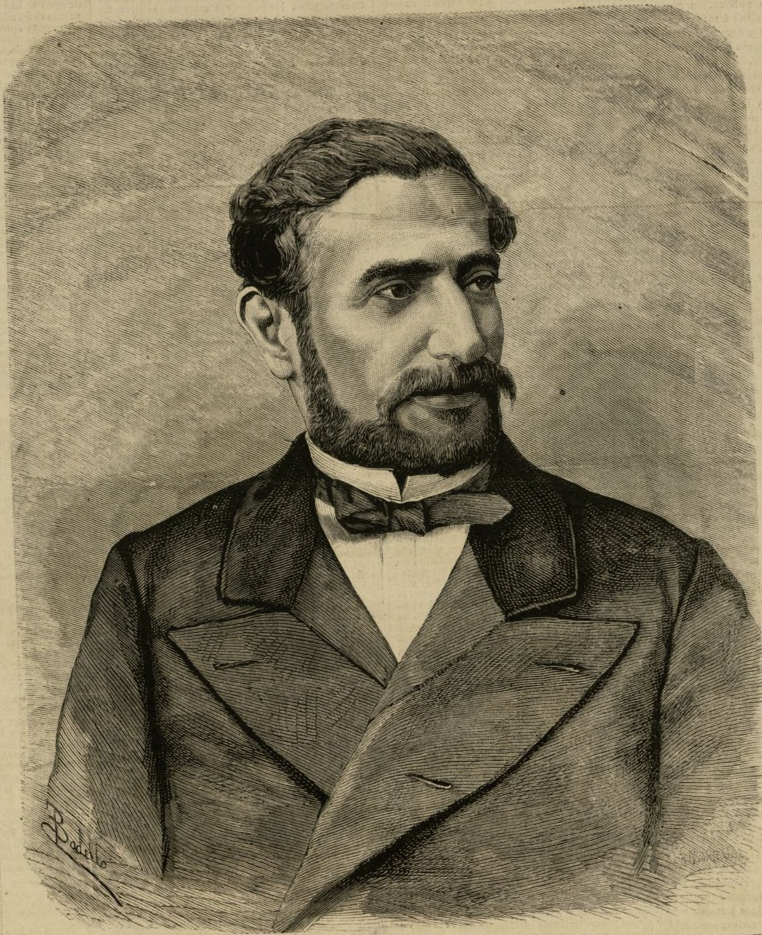
DON PRÁXEDES MATEO SAGASTA

No tenemos el propósito de hacer una biografía del eminente hombre público cuyo retrato publicamos en esta primera plana; de aquí que pasemos por altola época más brillante y más penosa, á un tiempo, de su vida política en que fué el cerebro de la revolución de Setiembre y en que dedicó todas sus facultades al afianzamiento de las libertades patrias y á la consolidación del sistema parlamentario; pero no podemos menos de expresar aquí una opinión profundamente arraigada en el pensamiento del partido liberal que Sagasta trajo noble y generosamente en derredor de la monarquía de D. Alfonso XII, y es la de que todos los esfuerzos que, desde hace 25 años, viene haciendo por afirmar la libertad, por salvar los intereses sociales y por encauzar la política de su país hacia ideales más puros y hacia fines más regeneradores, no suman tanto como los sacrificios que lleva hechos,—quizá inútilmente—por afianzar la monarquía restaurada en la conciencia liberal de España, y porque de una vez entremos en la vida pacífica y normal de los pueblos civilizados.