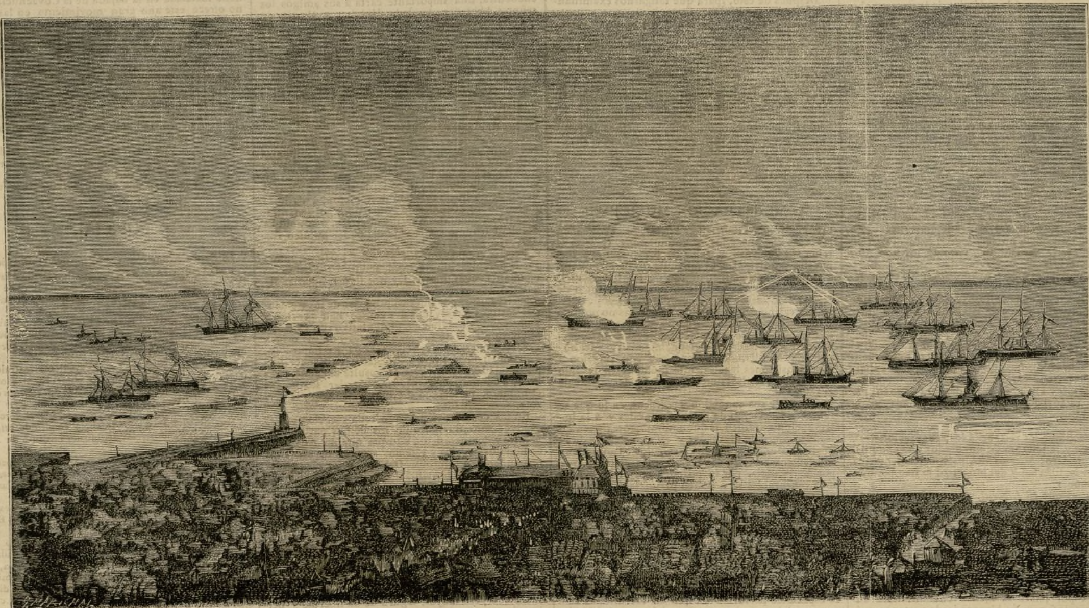
FIESTAS DE CHERBURGO.—EL ZAFARRANCHO

Por fin á las once terminaron, con magníficos fuegos artificiales, estas fiestas dignas de la marina y de la República francesa.