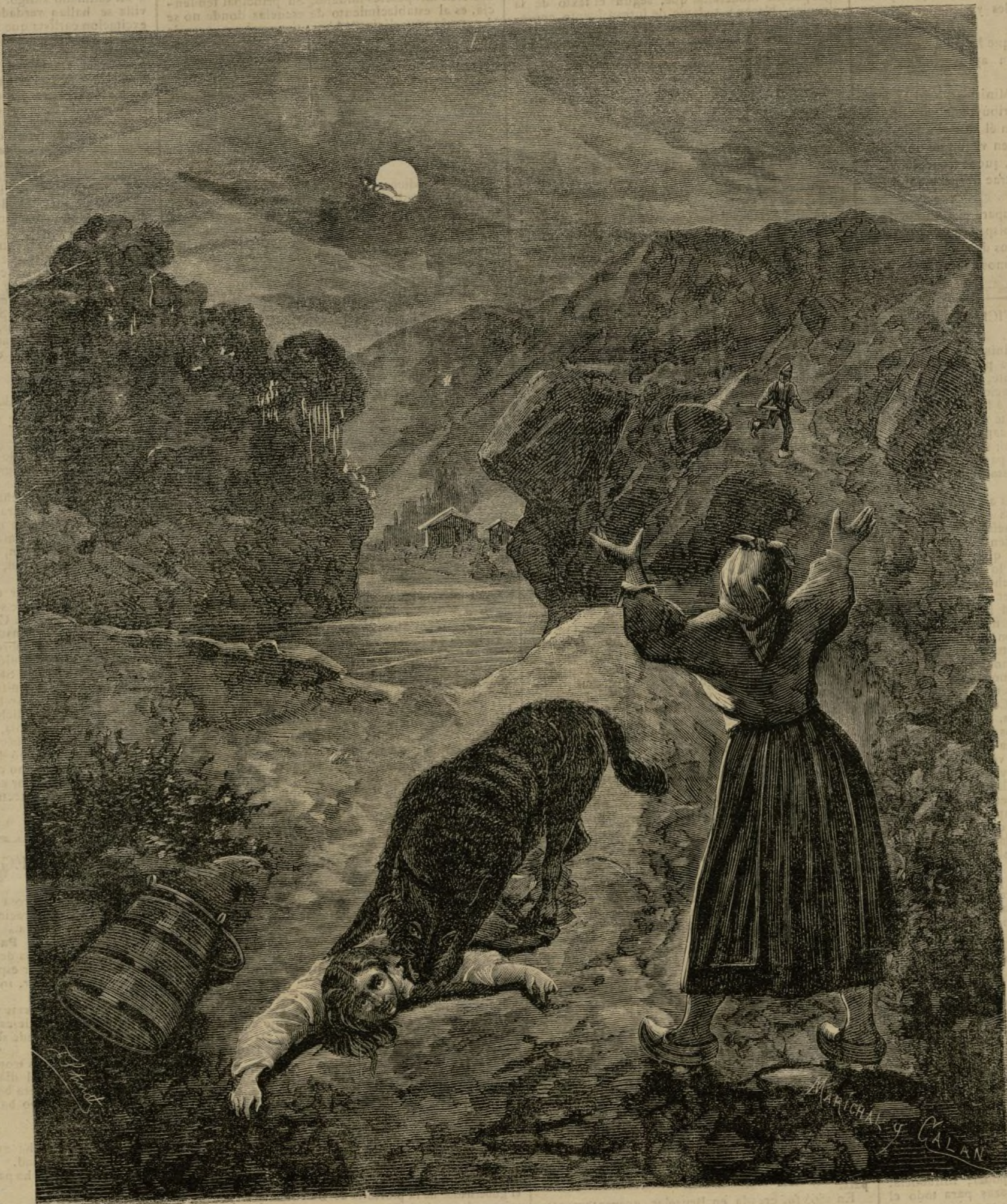
LOS LOBOS RABIOSOS DE GALICIA

De esperar es que con los auxilios enviados por las autoridades superiores de la provincia, se lleve á cabo la total destrucción de tan encarnizados enemigos, y se devuelva la calma y la tranquilidad, á aquella consternada comarca.—T.