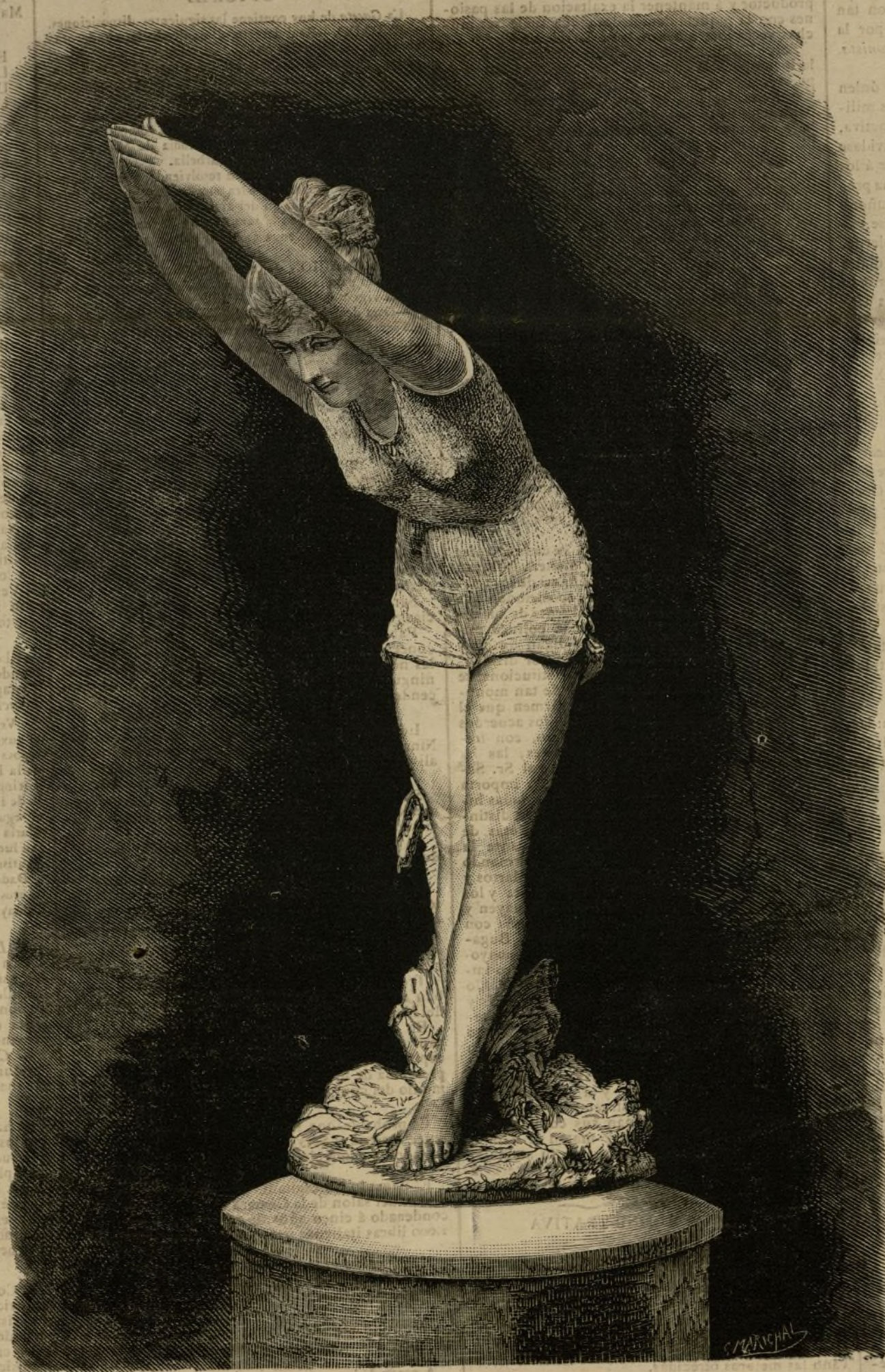
LA TUFFOLINA.—ESTATUA DE O. TABACCHI