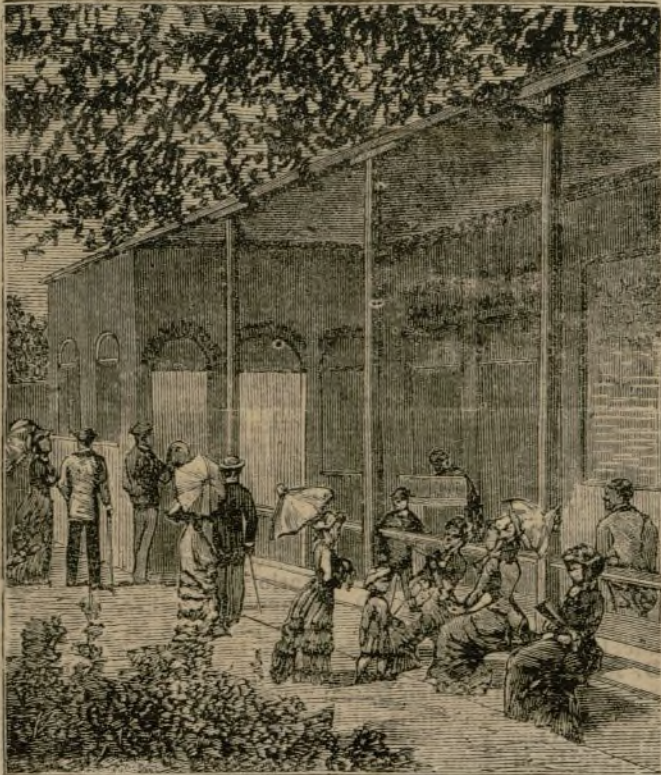
GRAN SALON DE DESCANSO

Por un baño de primera en pila de mármol, ..... " 2 Id. id. de segunda en pila de piedra, ..... " 50