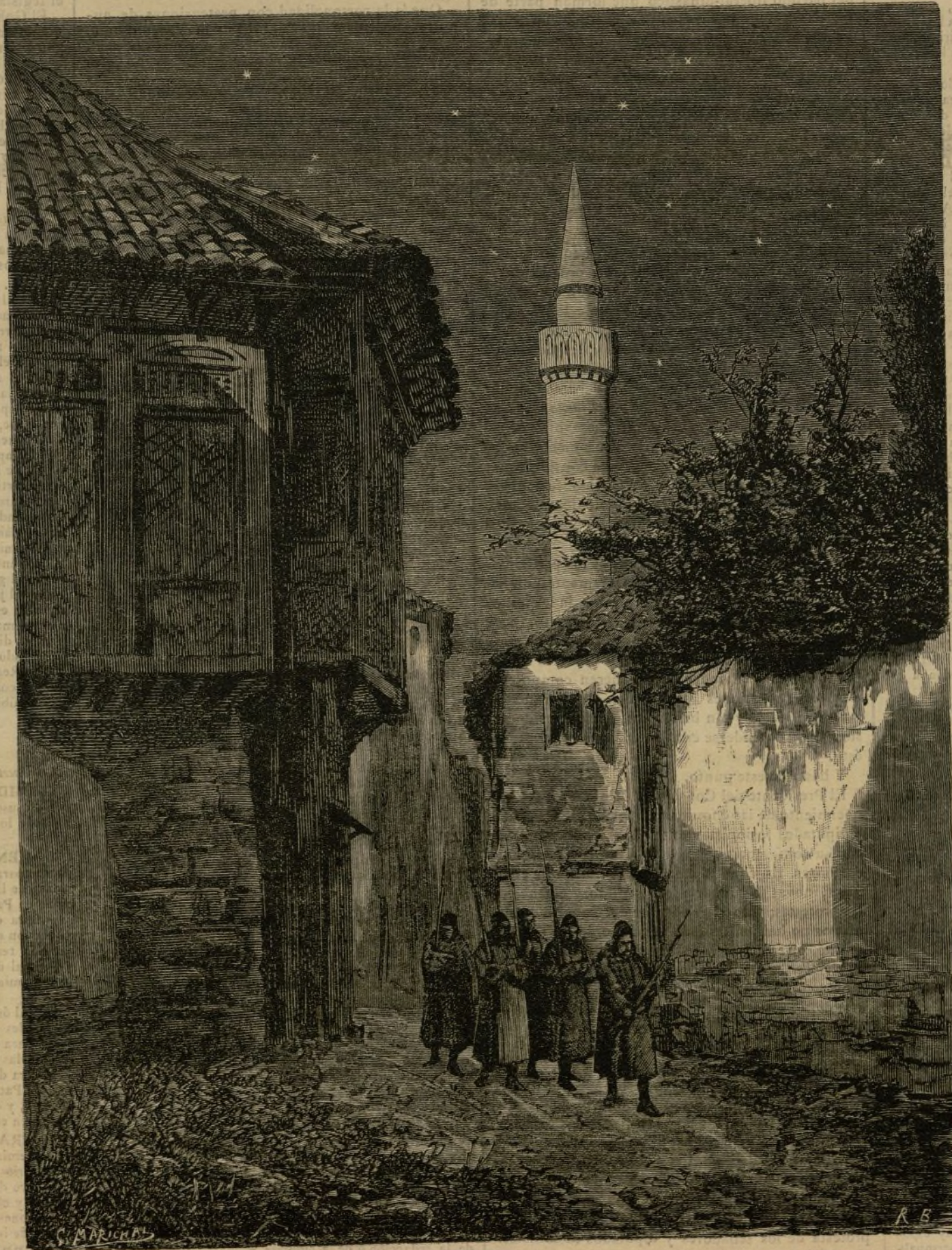
Ayuntamiento de Madrid UNA RONDA EN CONSTANTINOPLA

Pronto, muy pronto los restos del Hotel de la Providencia irán á unirse tal vez con los del edificio de la calle de la Escuela de Medicina, donde murió el demonio del patriotismo.