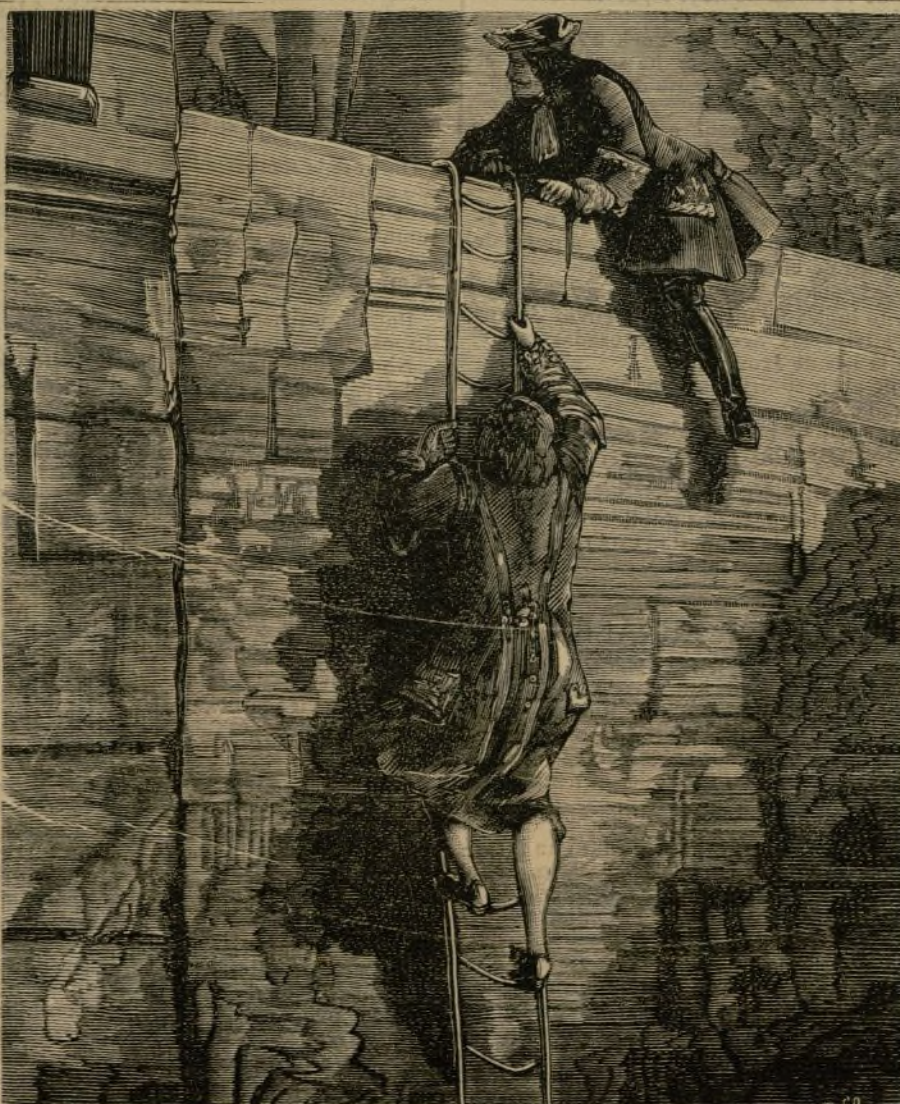
Helion hizo manualmente lo que el Ayuntamiento de Madrid invitaba á hacer.

Notábase en él algo de lo que advertimos en su hermosa vecina: visibles rasgos de ave y de serpiente.