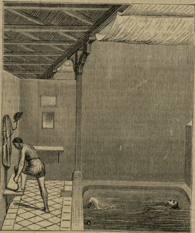
BAÑOS DE FAMILIA

Por un baño de primera en pila de mármol..... " 2 Id. id. de segunda en pila de piedra..... " 50