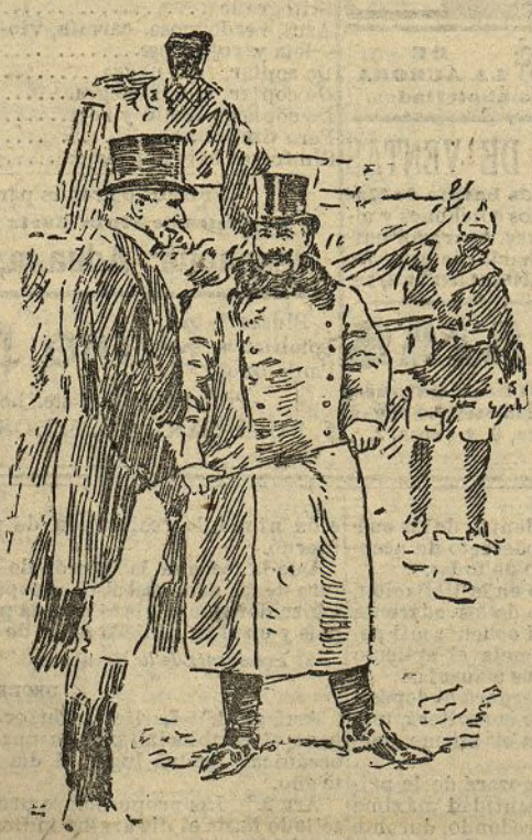
El Kaiser sportman

bre-idea. Para el lector culto no hay ese peligro y la obra es de gran utilidad, pues le revela la psicología de un César son idénticas—dice. Ambos disponen de los mismos medios para so-