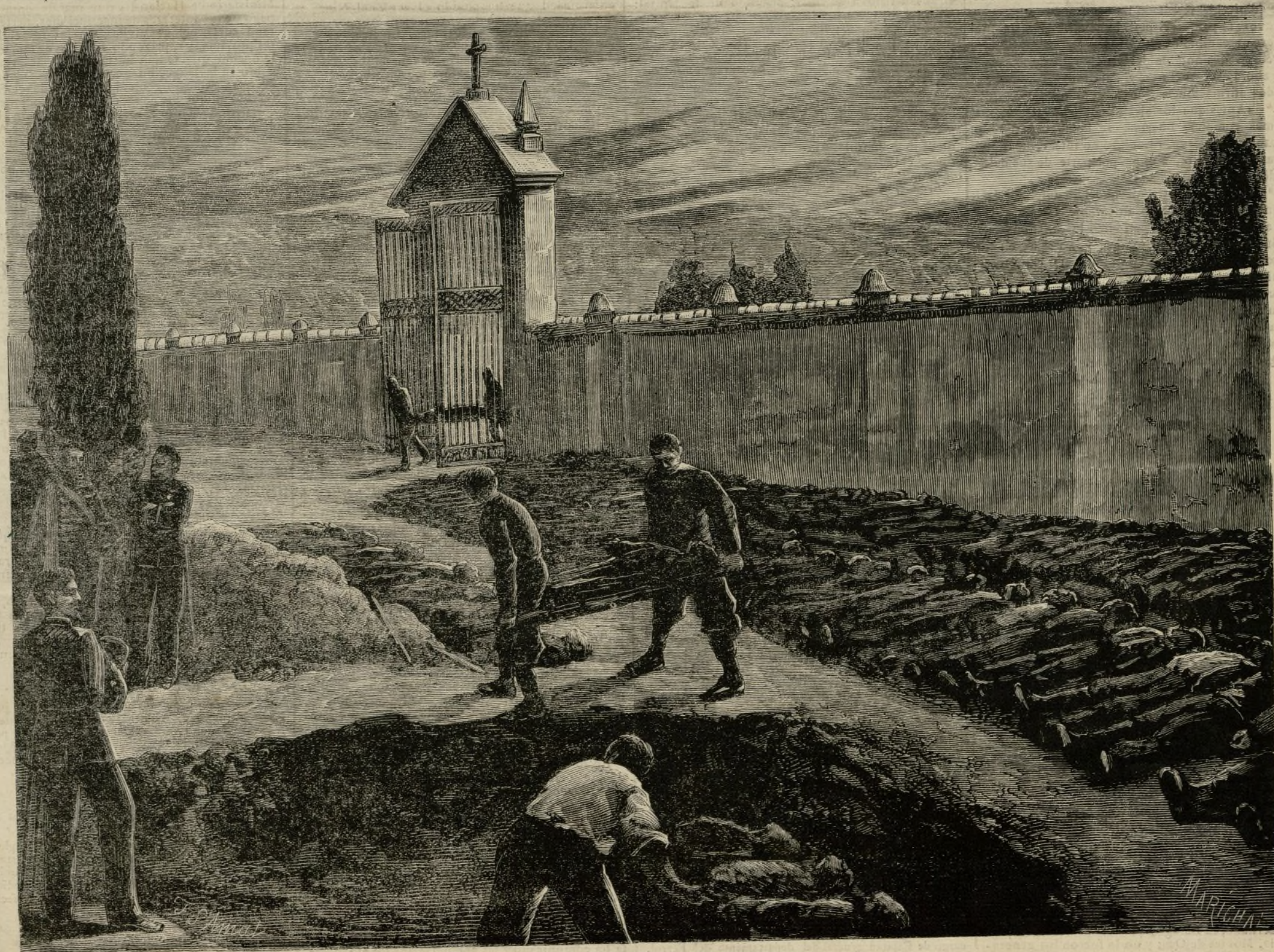
LOGROÑO.—ENTERRAMIENTO Ayuntamiento de Madrid. GADA DEL 2 DEL CORRIENTE Croquis de nuestro dibujante Sr. F. S. Amat

Es el único y triste privilegio que ha cabido á los restos de estos desgraciados militares que han encontrado una muerte prematura, y sin gloria en las aguas del Ebro. ¡Séales la tierra ligera!—T.