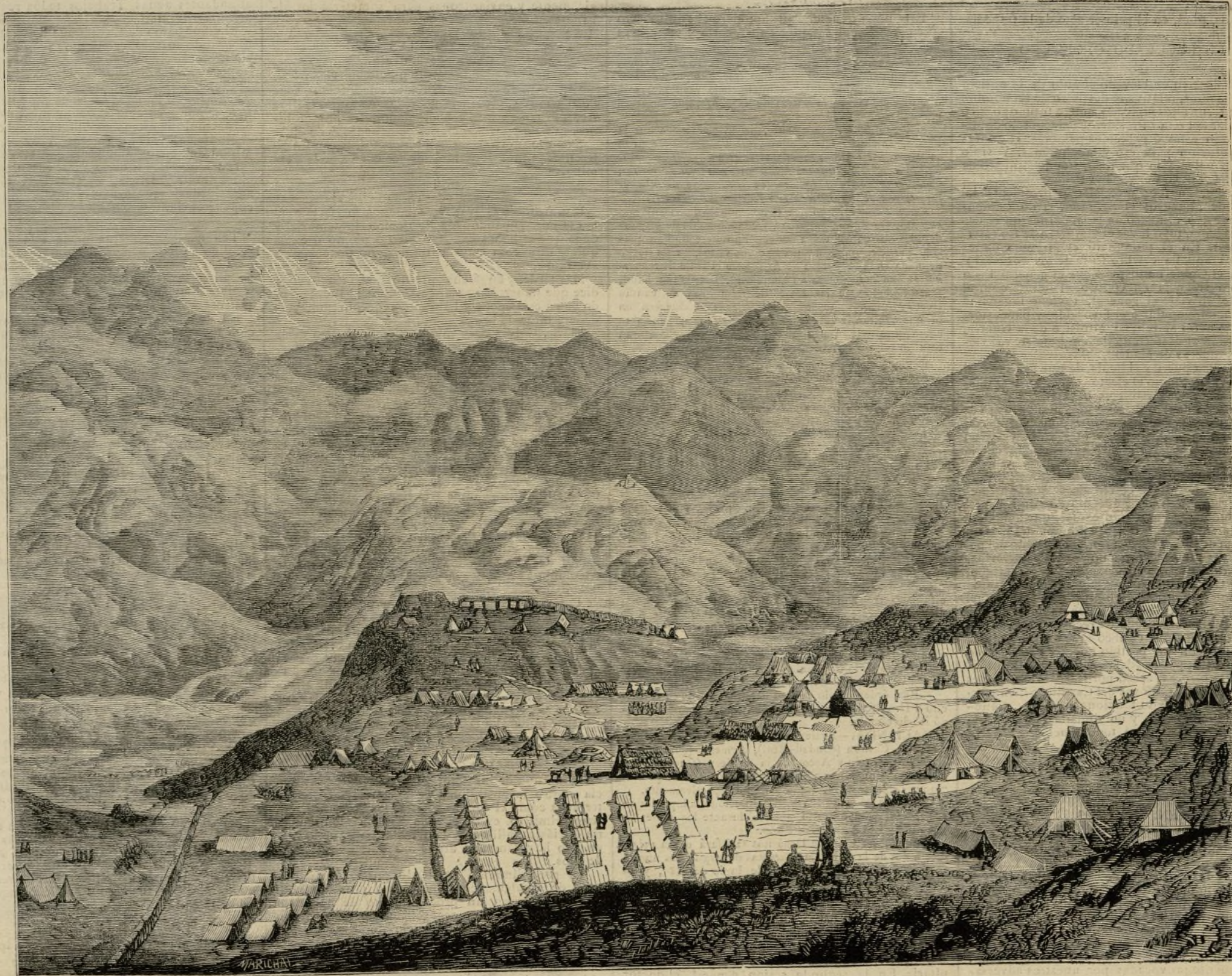
GUERRA DEL AFGHANISTAN. CAMPAMENTO DE LAS TROPAS INGLESES EN PERZOWAN

El grabado que hoy ofrecemos á nuestros lectores, representa el campamento ocupado por las tropas del general Phayre al cruzar las referidas montañas.—T.