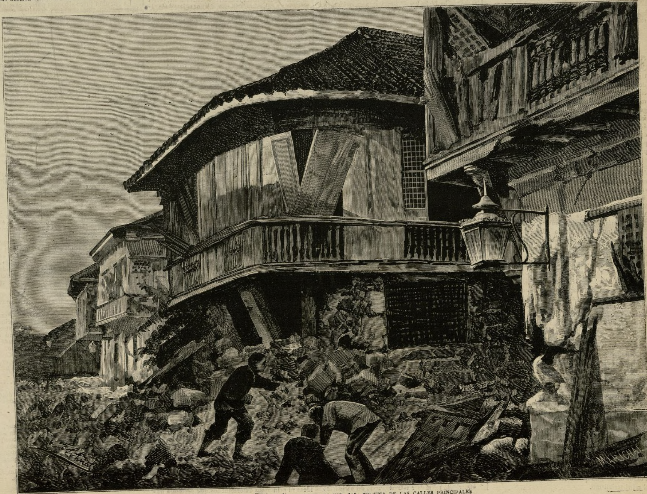
TERREMOTOS DE FILIPINAS.—Ayuntamiento de Madrid

Las iglesias y conventos derruidos, en su mayor parte en la provincia de La Laguna, ningún mérito tenían bajo el punto de vista arquitectónico, y distaban bastante de contribuir al embellecimiento de las poblaciones. De su reconstrucción nada incumbe al gobierno, porque se efectúa por los fondos del Sanctorum , denominacion que se da en Filipinas á la parte de la contribucion directa, el tributo ó reconocimiento de vasallaje que paga el indio, y que se destina á satisfacer los estipendios de los curas