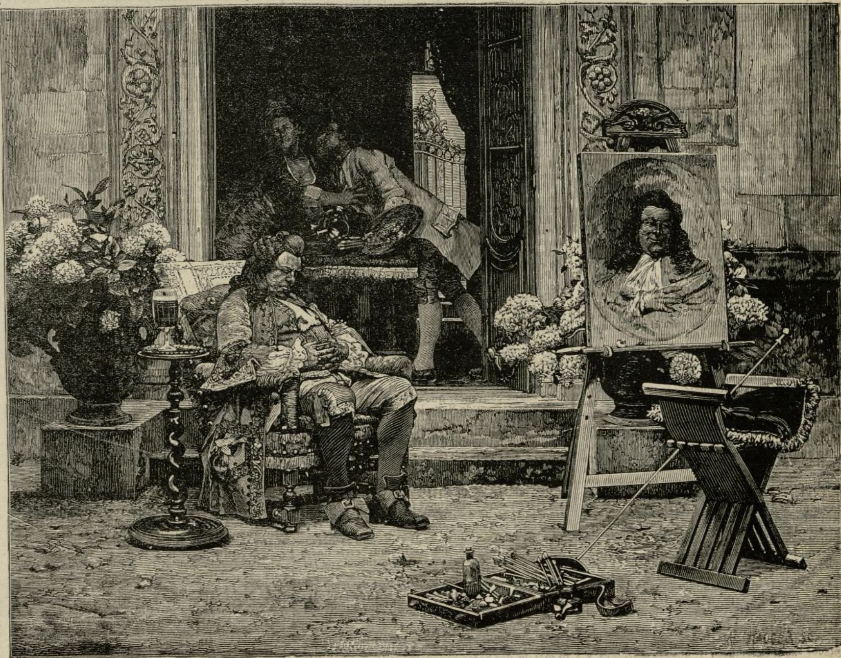
EL DESCANSO DEL PINTOR.—(Cuadro de M. Vibert.)