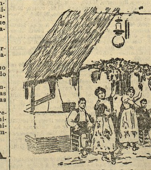
Ante la barraca.—Baile popular

La mirada atónita, como petrificada en un éxtasis, como atolondrada por la admiración, se desfilan por centenares a las más bellas valencianas, herederas legítimas de aquellas espléndidas hermosuras que inmortalizaron a Grecia.