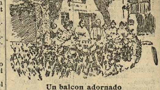
Un balcon adornado

Estos días son en Valencia días de júbilo alocado, intenso, extraordinario. Las estaciones arrojan sobre la población ríos de gente. El cielo rutila sobre la población ríos de gente. El cielo rutila sobre la población ríos de gente. El cielo rutila sobre la población ríos de gente.