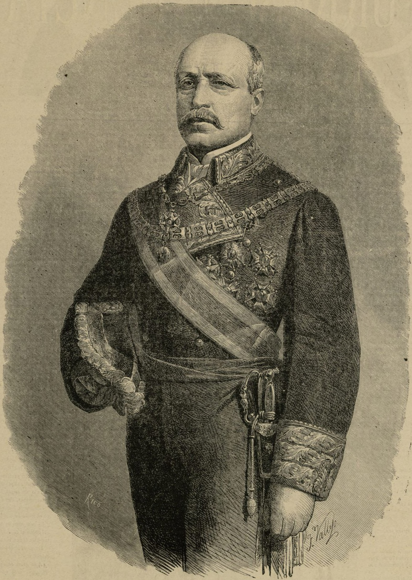
EL DUQUE DE LA TORRE