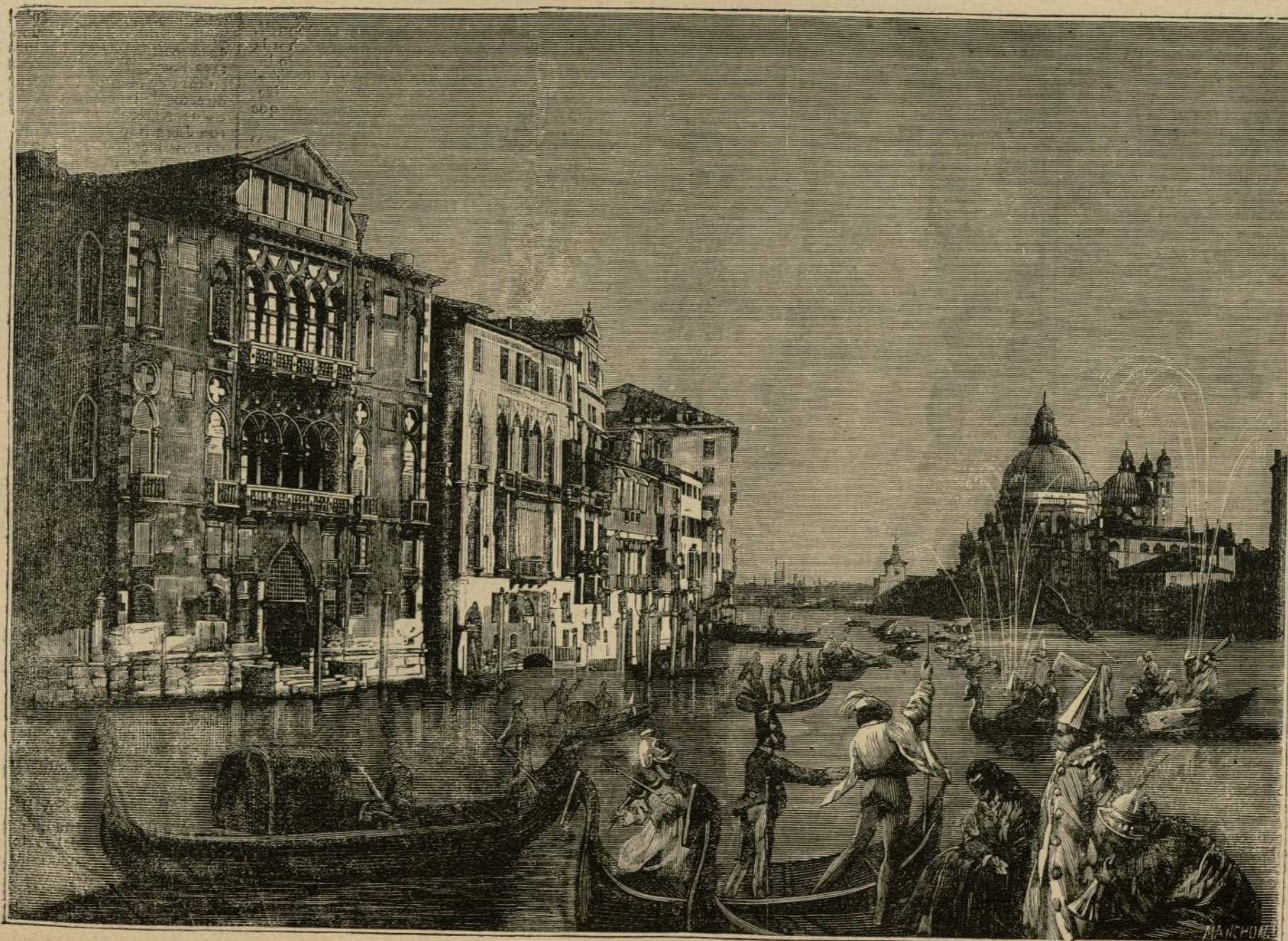
EL CARNAVAL EN VENECIA Ayuntamiento de Madrid

¡Triste destino el de los pueblos! La rica ciudad que fué un día rival de la opulenta Tyro y de la guerrera Cartago, y casi árbitra de los destinos de Europa, yace solitaria y silenciosa envuelta como en un sudario en el manto de sus antiguas glorias. Al contemplar sus hermosos monumentos, acude á nuestros labios la elocuente frase de Bossuet, después de admirar la sublime grandeza de las Pirámides: «¡Ah! no son sinó sepulcros!»—T.