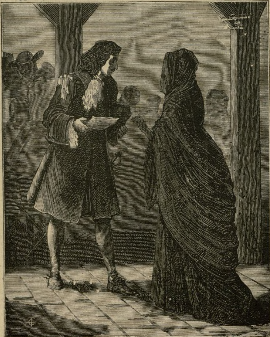
Y Felipe sacó de su bolsillo un libro de papeles que entregó á la desconocida.

—Pero no debia serlo de mí, señor Marqués,—replicó el Regente con voz alta.—¿Habeis olvidado