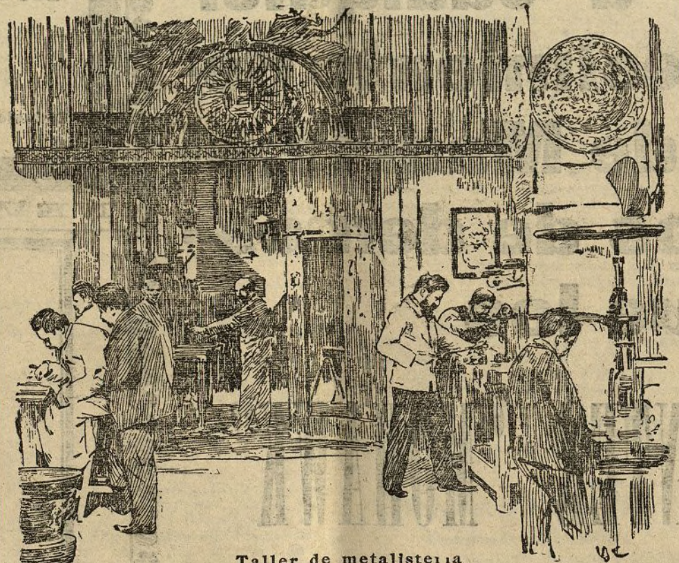
Taller de metalisteria