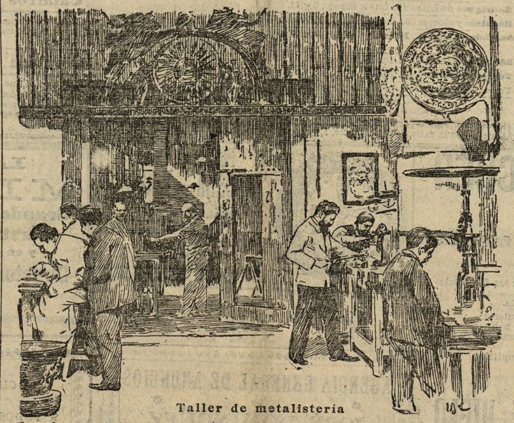
Taller de metalisteria