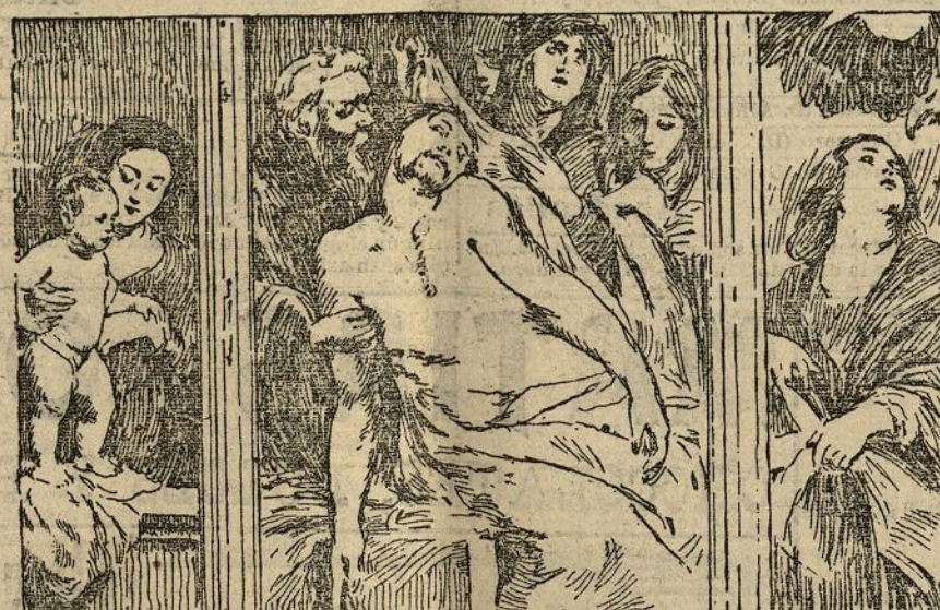
El triptico de Rubens, titulado «El Cristo de la paja», existente en el Museo Real de Anvers

El mar del Norte ha hecho en las tierras bajas una cortadura profunda: en lo más hondo de ella se emboacan las aguas del Escalda. El río, anecho allí como un brazo de mar, abre paso a los gran les bajeles que traen y llevan la riqueza del mundo: los rubios trigos; las maderas, más rubias que los trigos; que vienen de Noruega la blanca y aún huelen a bosque y a resina; el café de Oriente; el tabaco de Occidente; las pieles preciosas del Septentrión extremo. Estos bajeles, gloria del mundo, puesto que traen su riqueza en los vientres, éntranse río abajo; pasan con desdén a la vista de unas cuantas aldeas que parecen dormidas en las márgenes, entre praderas verdes y canales azules, y vienen a atracar en la orilla derecha, al amparo de las fortificaciones de Anvers.