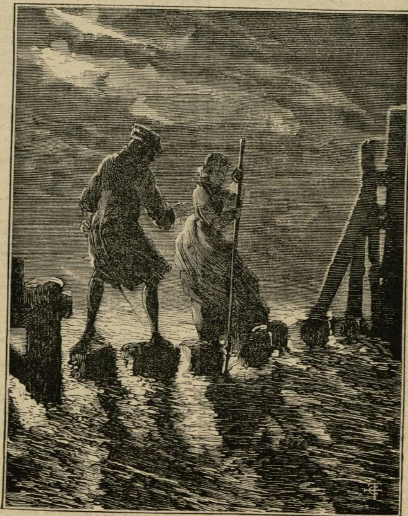
Si el pié se desliza, allí está la muerte.

EL CID Nuevo y gran Bazar de ropas hechas. Calle Tetuan, 23, entre la calle del Carmen y la de Preciados. Se acaba de completar para la temporada de invierno el grandioso y rico surtido en trajes, todo nuevo y recién construido con la mayor perfeccion y elegancia é increíble baratura. Especialidad en capas, carriks, rusos, paletós, levitas y sacos.