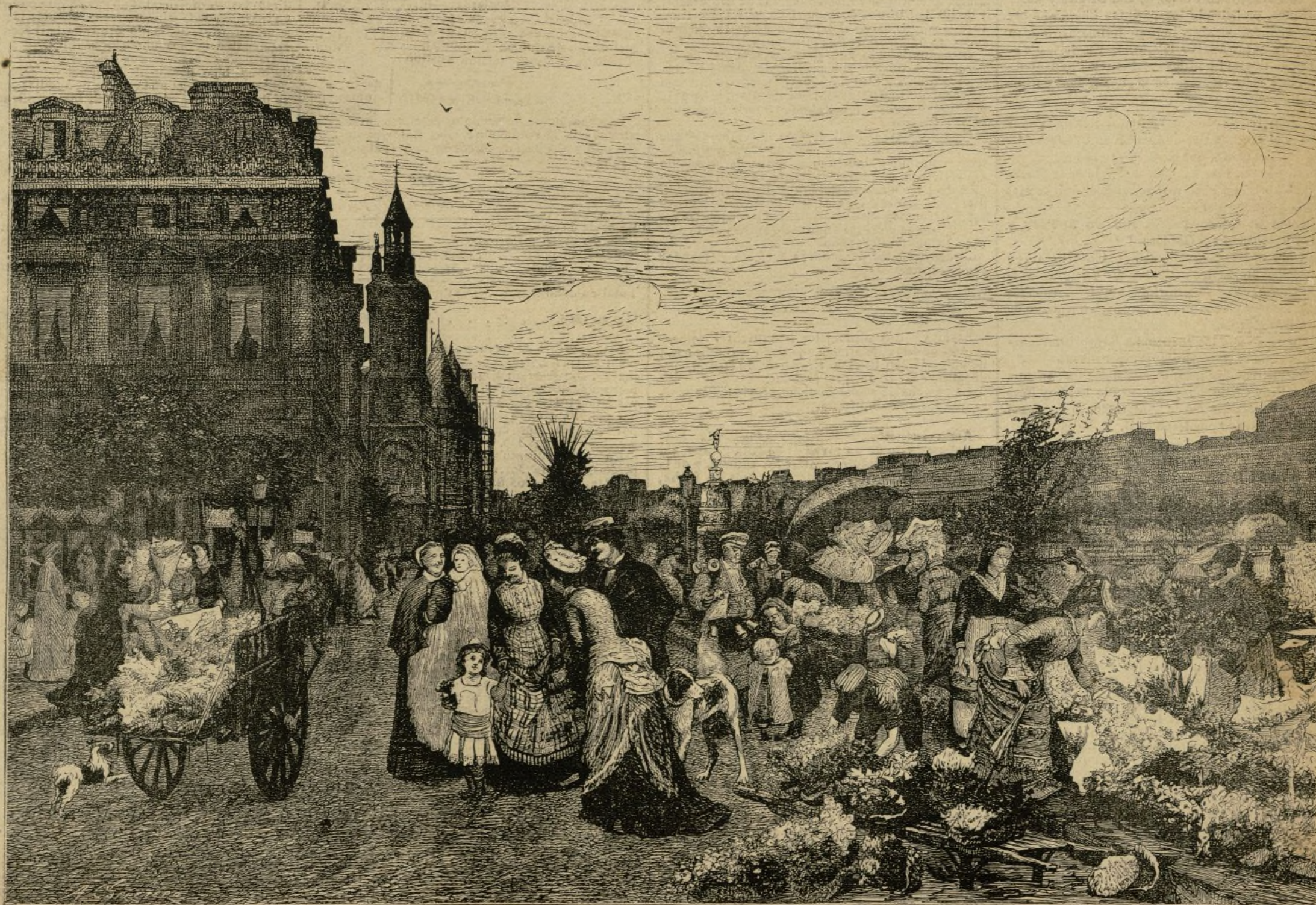
EL MERCADO DE FLORES EN PARIS.—(Copia del cuadro de M. Firmin Girard) Ayuntamiento de Madrid