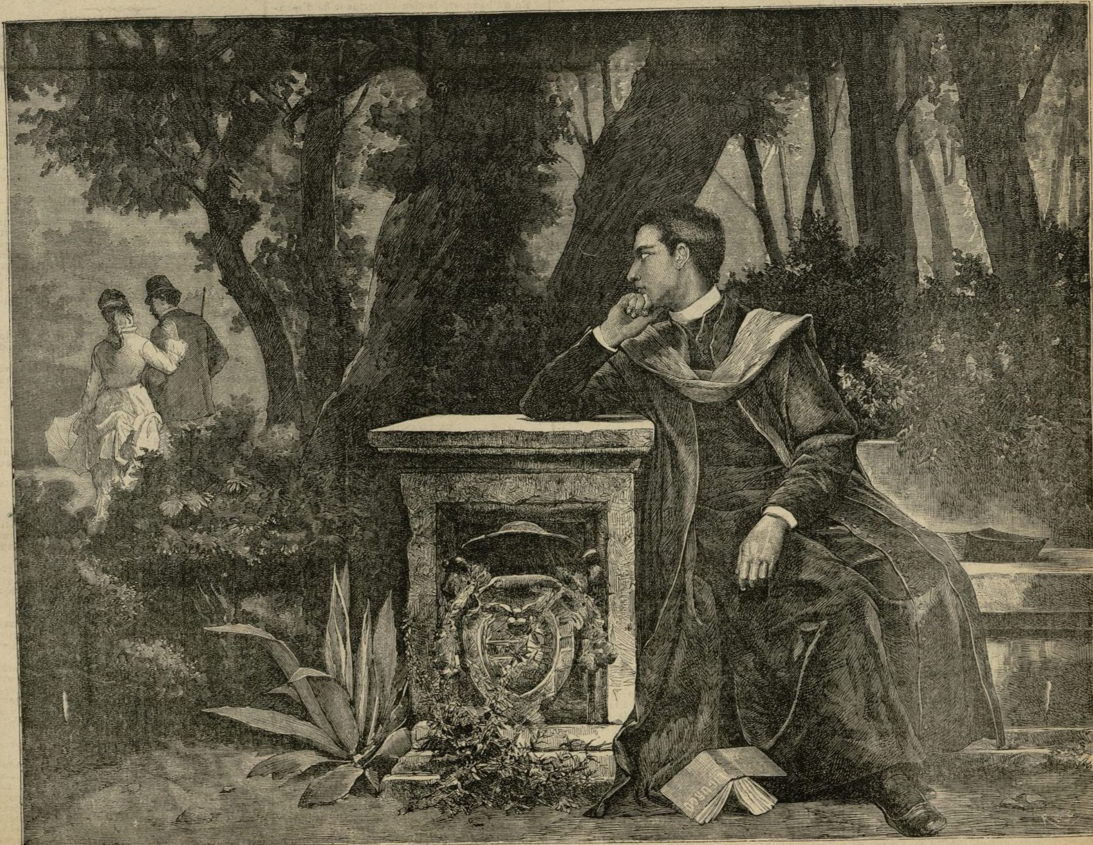
VACILACION.—(Dibujo de D. A. Perea.) Ayuntamiento de Madrid