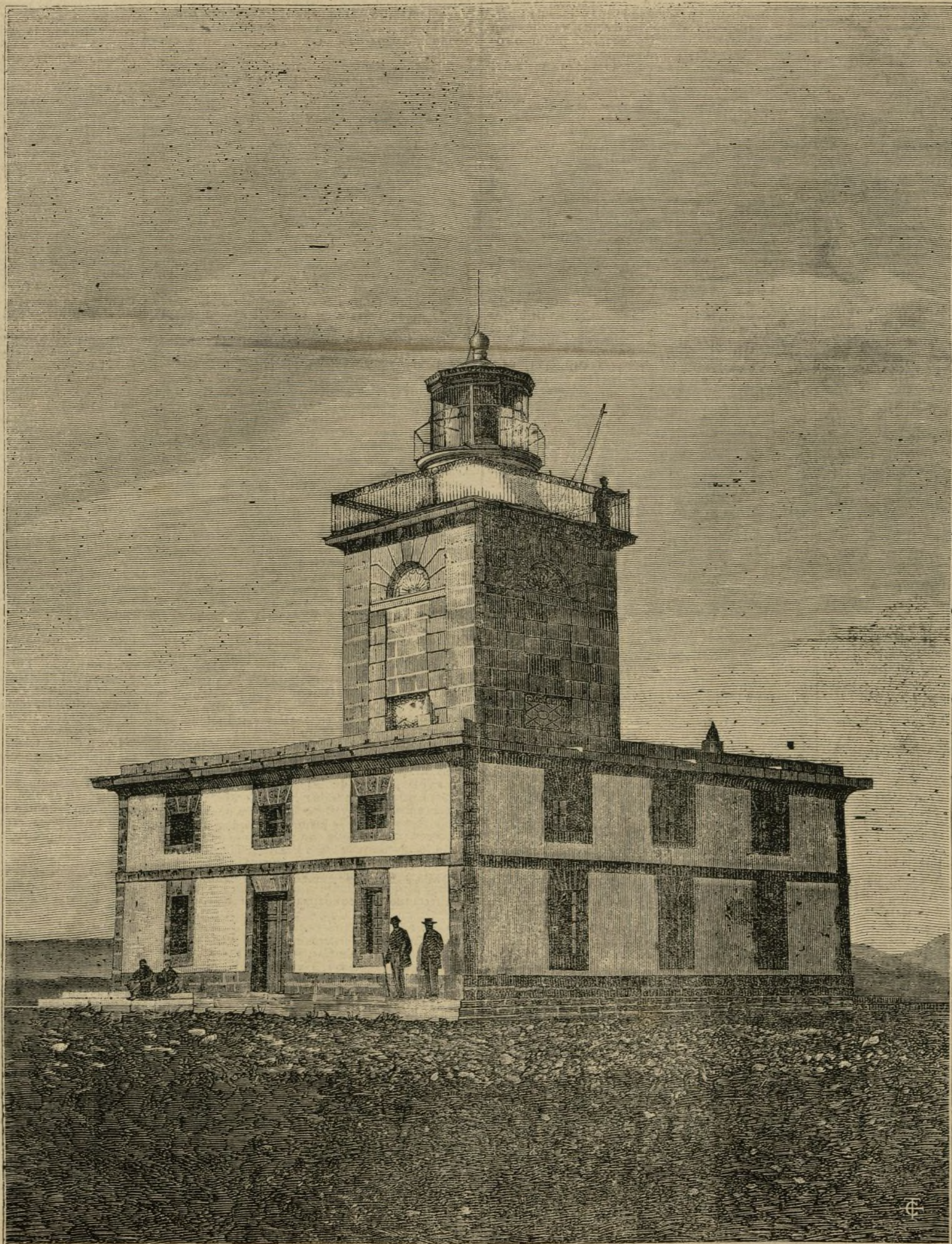
FARO DE LA ISLA DE TABARCA.

Aun hoy mismo, que gracias al impulso que al ramo de obras públicas han impuesto en épocas no lejanas gobiernos liberales