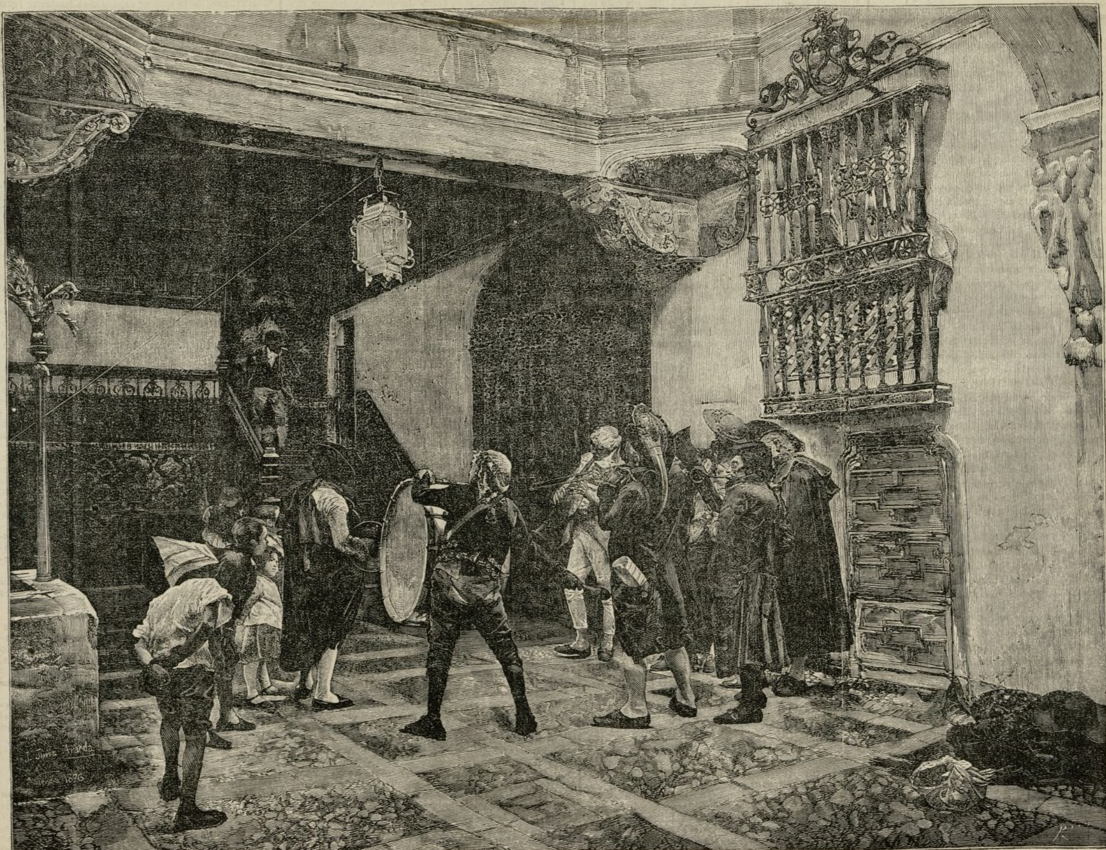
UNA MURGA EN EL PATIO DE UN PALACIO DE VALENCIA. (Cuadro del Sr. Jimenez Aranda). Ayuntamiento de Madrid

La única diferencia que á nuestro entender existe entre la murga de nuestros días y la del siglo, cuyos principales caracteres, vicios y defectos dibujó en sus preciados lienzos el atrevido pincel de Goya, consiste sólo, primero en algunos detalles de indumentaria, y segundo en la variación del menú musical con que obsequian ó mejor mortifican á sus favorecidos.