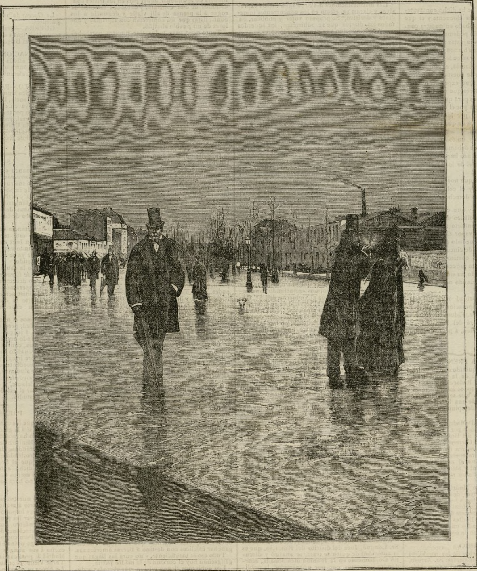
VOLVIENDO DEL ENTIERRO. (Copia del cuadro de M. Jiraud.)

Los erguidos esqueletos de los desnudos árboles, el cierzo frío que amontona en caprichosos remolinos las amarillentas hojas que alfombran la tierra, la indecisa luz crepuscular y el pardo manto de nubes que encubre la diafanidad de firmamento y todo ese conjunto de detalles que llamó el poeta latino